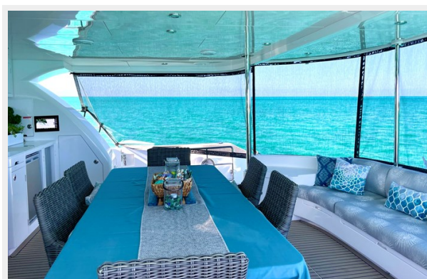
AFT DECK 2