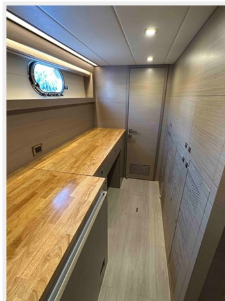
STB CABIN WORK BENCH