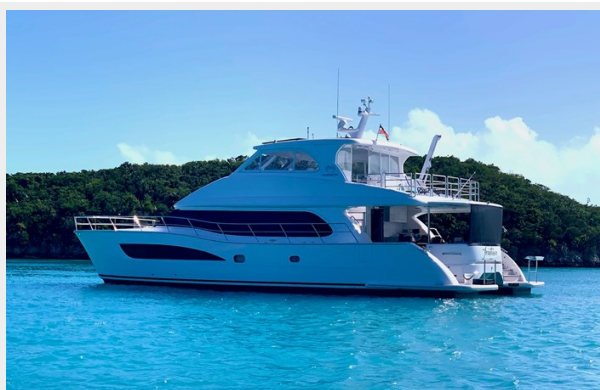
AT ANCHOR 2