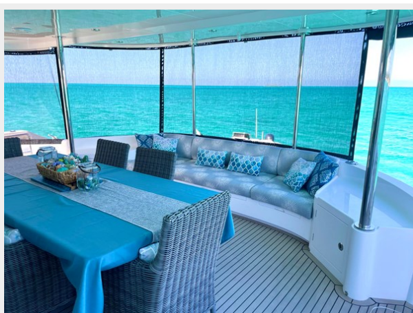
AFT DECK 1