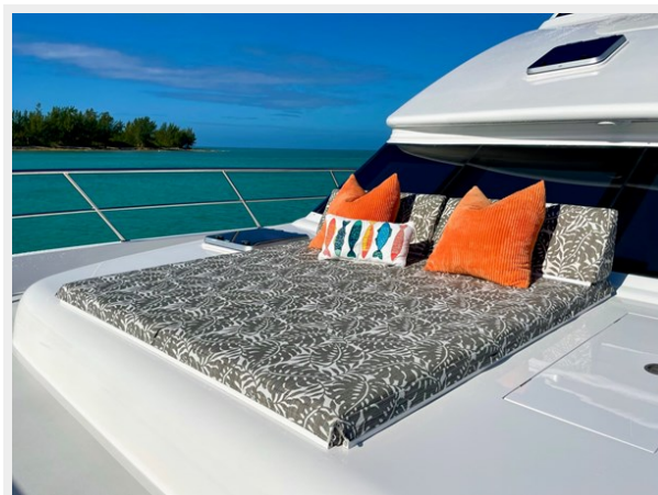
SUN LOUNGER 2