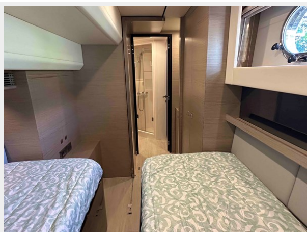
PORT TWIN LOOKING AFT