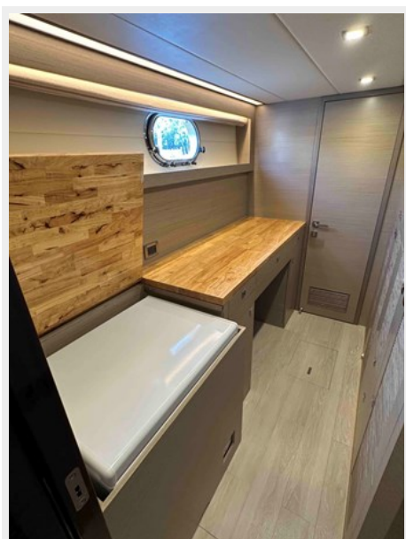
STB CABIN FREEZER