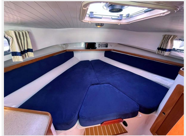
V-Berth with Filler