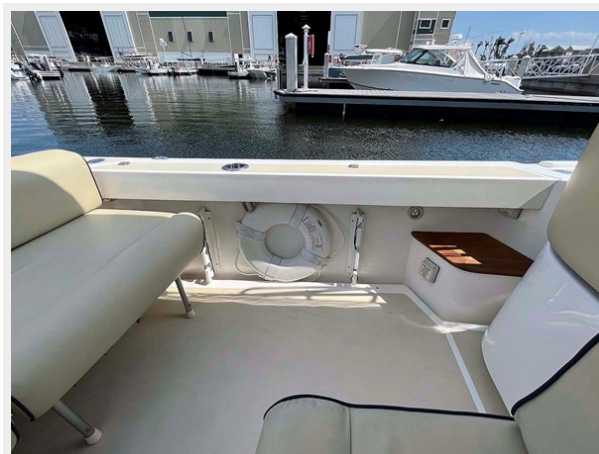
Port Cockpit Detail