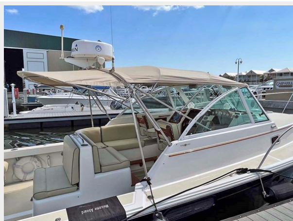
Bimini with Palm Beach Extension