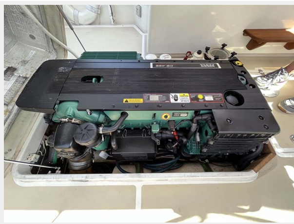
Volvo 435hp D6 Side View