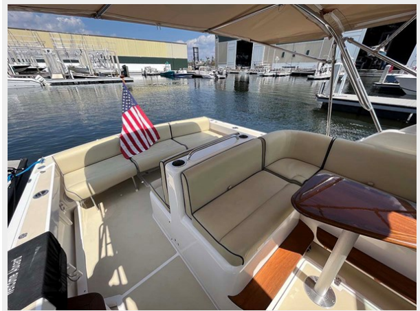
L-Settee Looking Aft