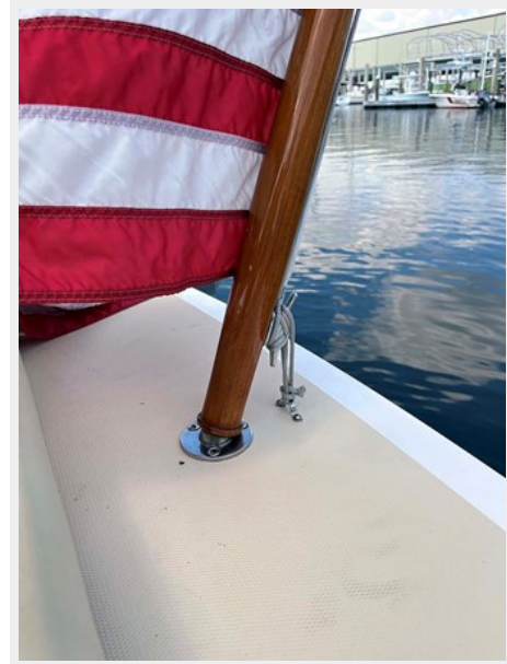
Bete Fleming Teak Staff for Ensign