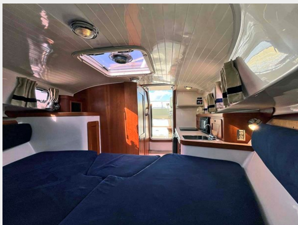
Interior, Looking Aft