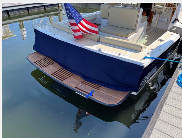
Transom Sunbrella Cover