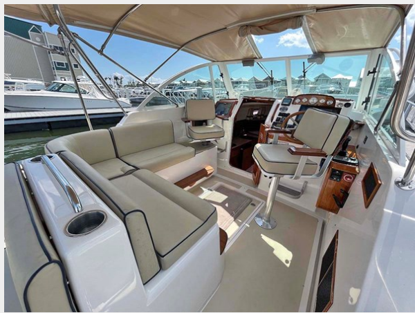
L-Settee and Chairs in Harbor Mode