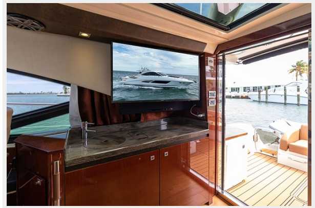
Stbd upper salon