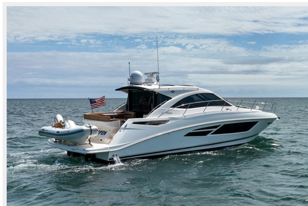
Stbd quarter profile