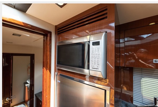
Cuisinart convection microwave oven and grill