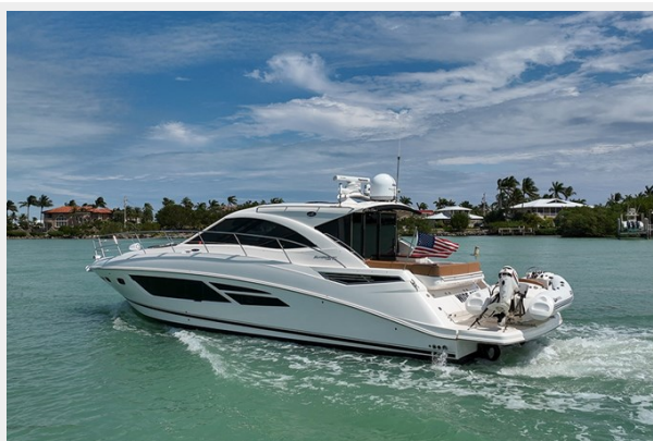
Port quarter profile