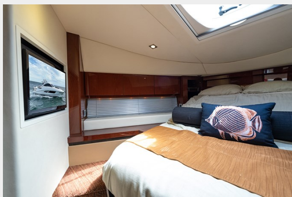
TV in the VIP stateroom