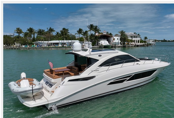
Stbd quarter profile