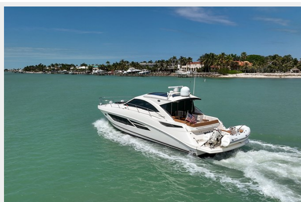
Port quarter profile