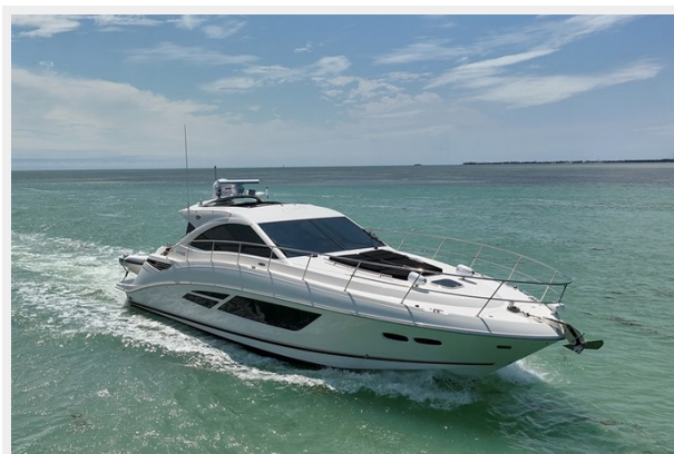
Stbd bow profile