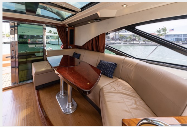
Port upper salon