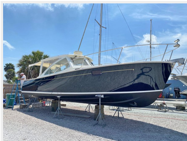
On Blocks Stbd Bow