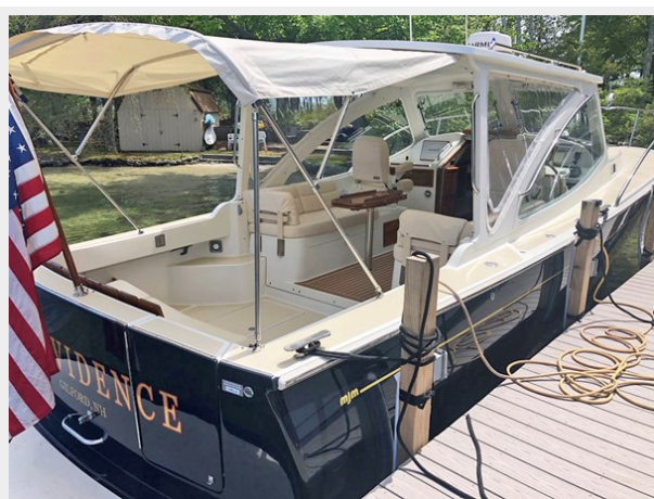
Transom & Cockpit from Dock