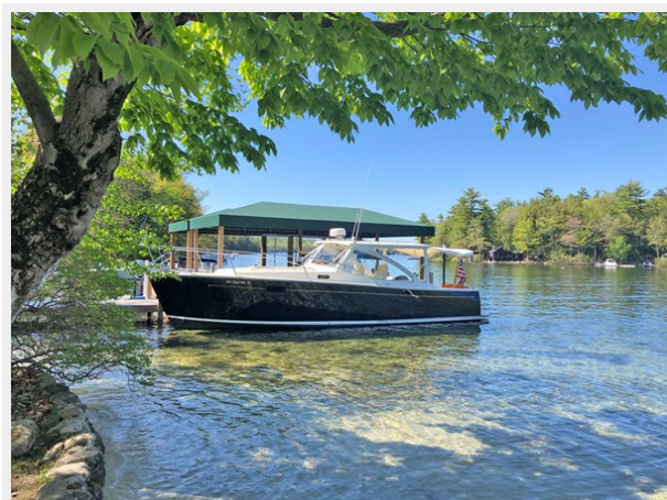
In Water Port Beam