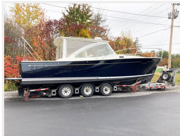
On Trailer Stb Beam