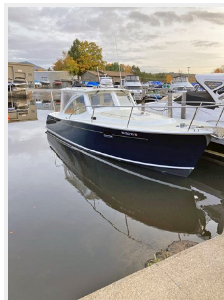
Dockside Stbd Bow