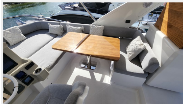
20220707_17.jpg (3) - Copy