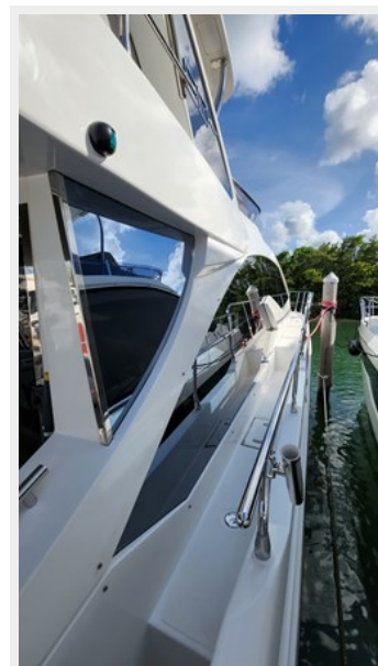
20220707_188 - Copy (2)