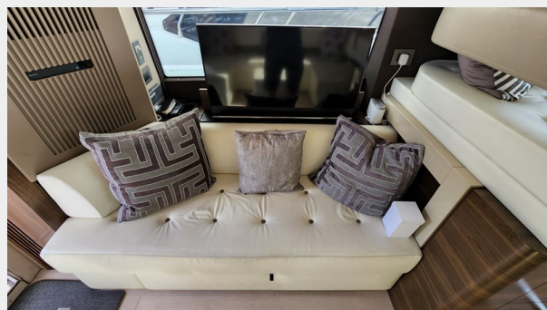
20220707_ - Copy (2)