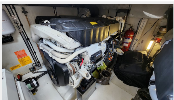
9999 - Copy