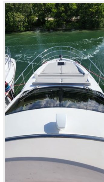
20220707 - Copy (2)