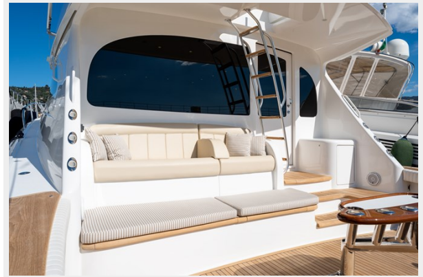
MY TIA exterior 1