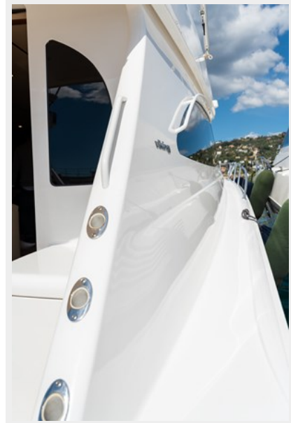
MY TIA exterior 13