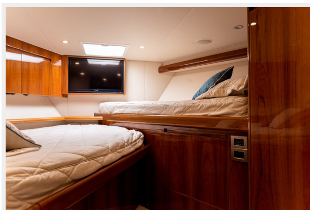
MY Tia Cabin 2