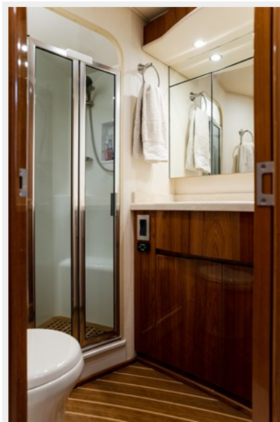
MY Tia Bathroom 2