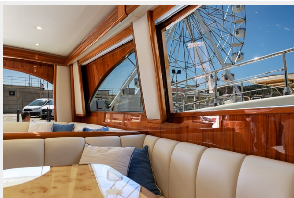
MY Tia Saloon 5