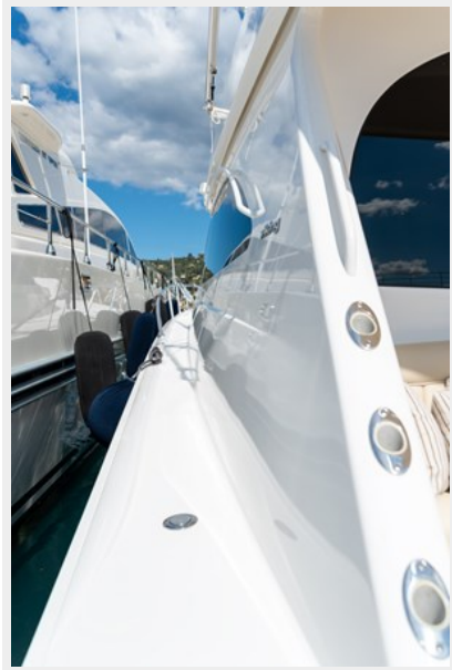
MY TIA exterior 12