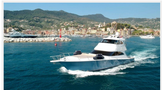
MY Tia Cruising 1