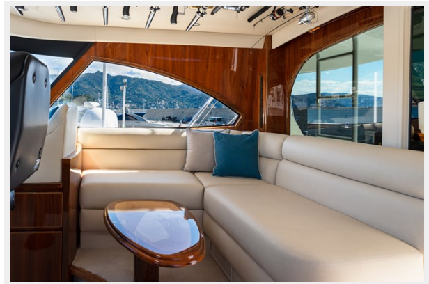
MY TIA cockpit 1