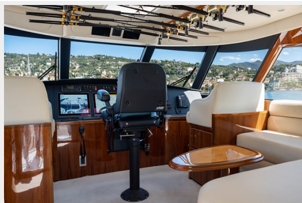
MY Tia cockpit 2