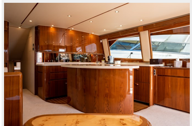
MY Tia Saloon 4