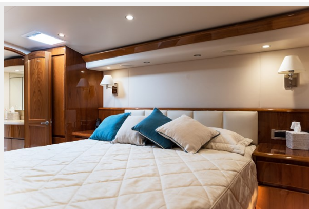
MY Tia Master Room 3