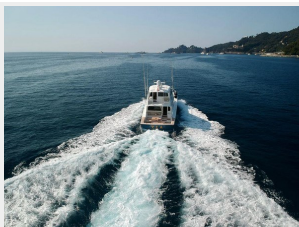
MY Tia Cruising 4