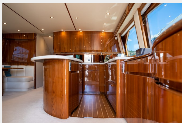
MY Tia Saloon 3