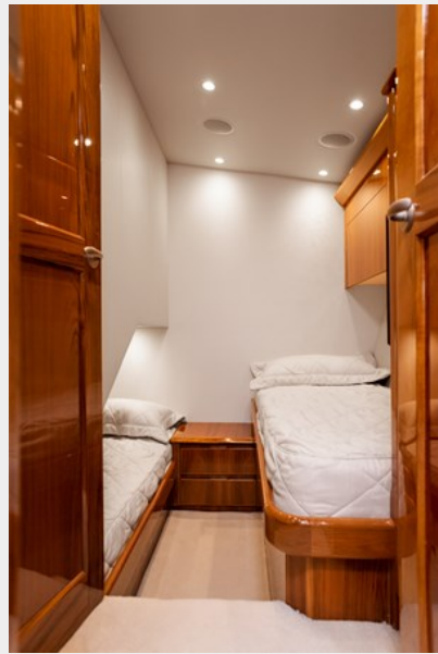
MY Tia Cabin 4