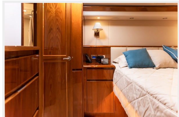
MY Tia Master Room 2