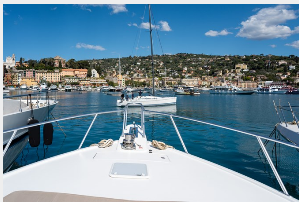
MY TIA exterior 8