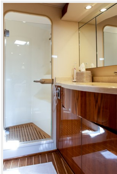
My Tia Bathroom 1