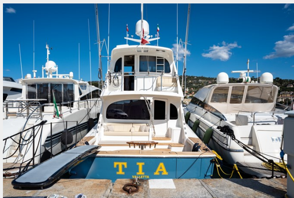
MY TIA exterior 4