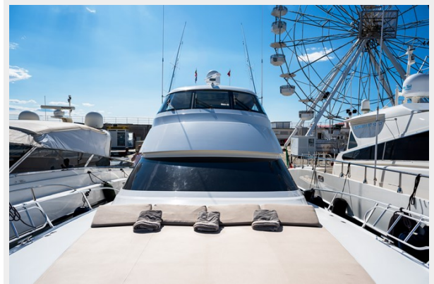
MY TIA exterior 7