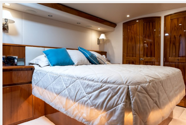
MY Tia Master Room 1