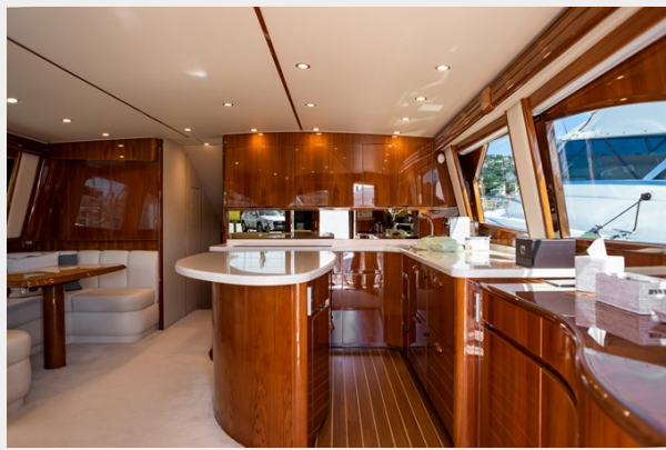
MY Tia Saloon 1