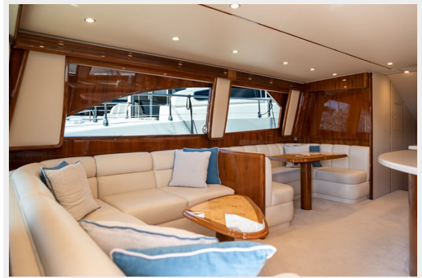
MY Tia Saloon 2