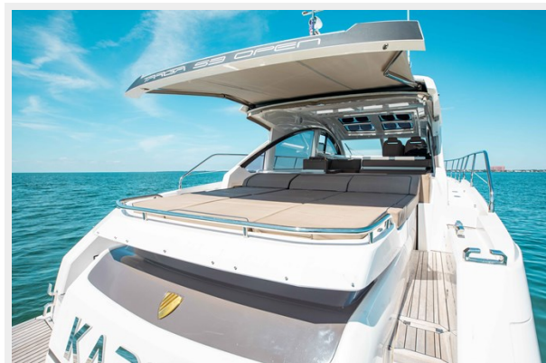
Aft Deck Sun Pad