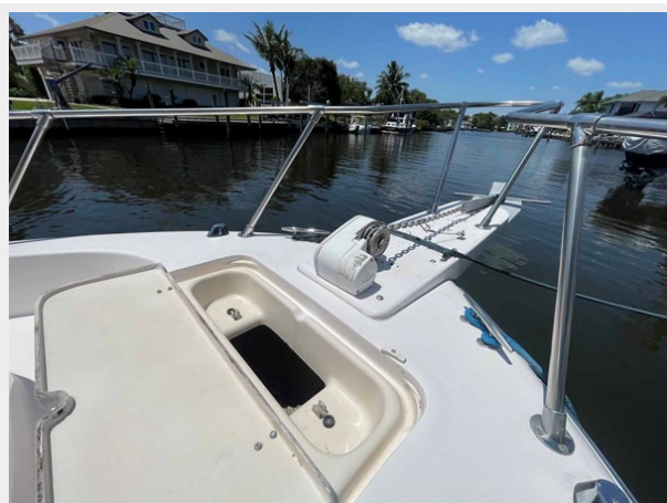
Anchor locker and windlass