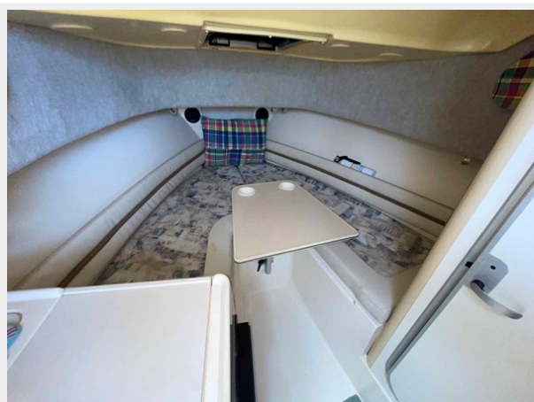
Pop-up table for dining in V-berth