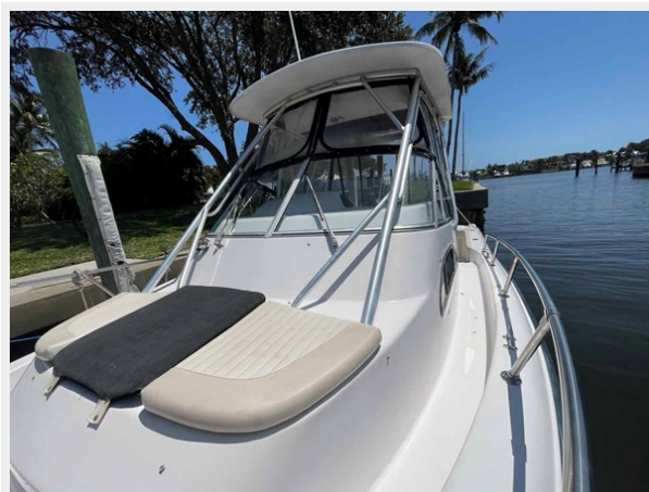
Bow seating area looking aft