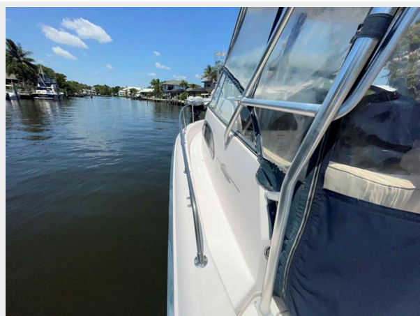
Port side walkway looking forward