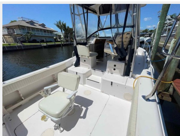
Cockpit looking forward