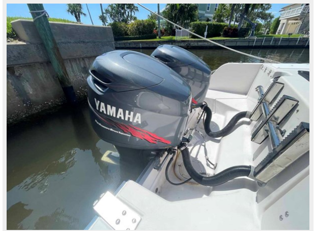
Swim platform and twin Yamaha HPDI's 200hp