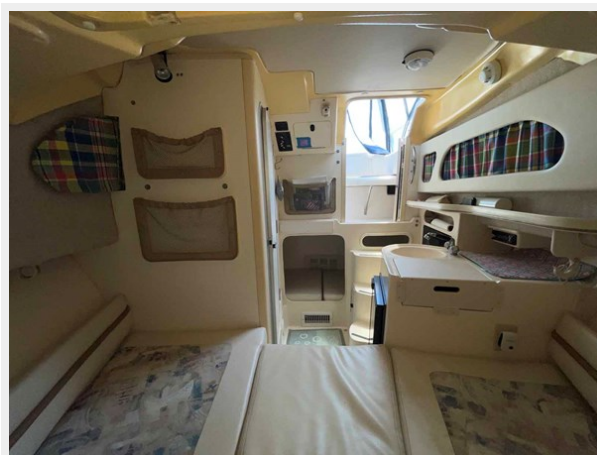
Cabin looking aft from V-berth