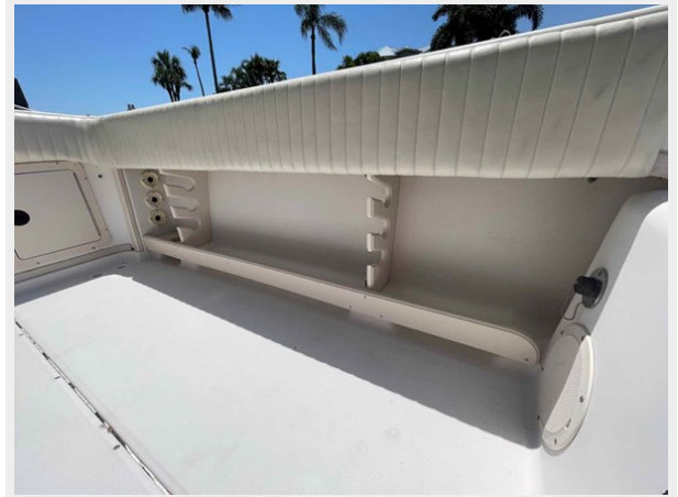
Port side under gunwale rod storage