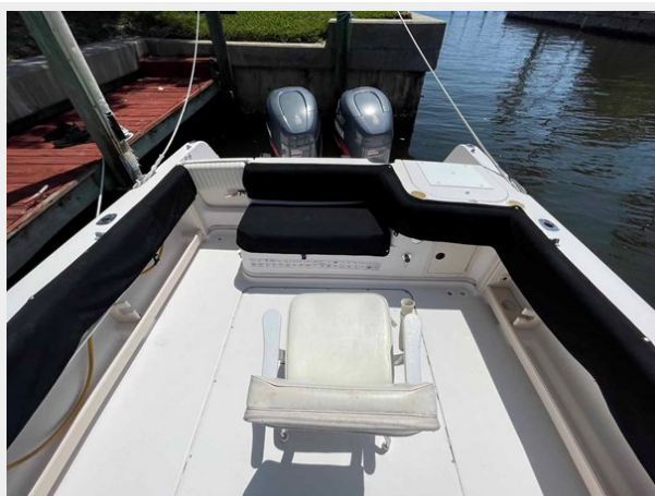
Cockpit looking aft with covers on