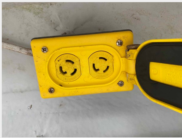
Electric reel receptacle under port cockpit gunwale