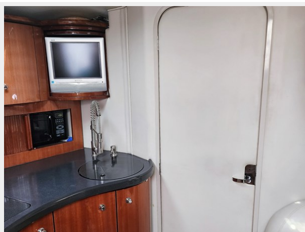
10-013 Mast Stateroom Door