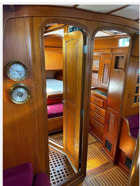
Fwd. Cabin and Head