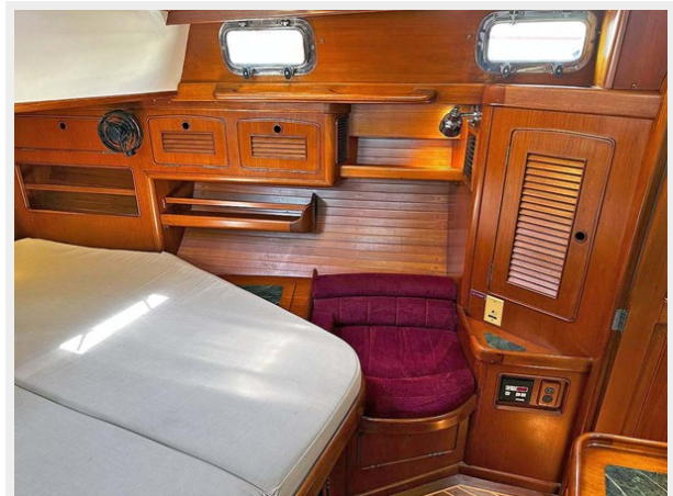
Aft Cabin, Port