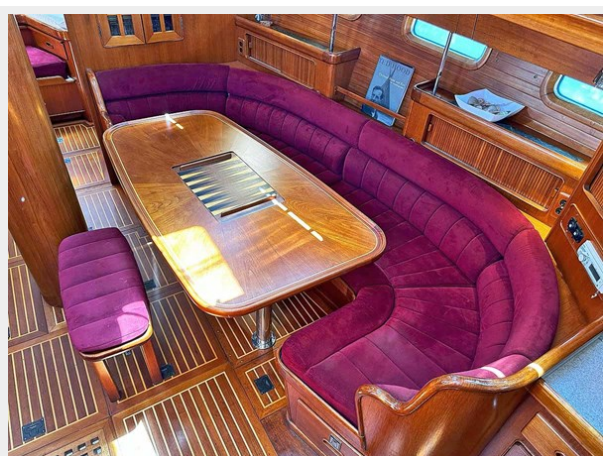
Stbd. Settee and Dinette