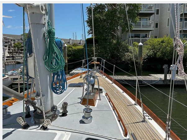
Stbd. Deck, Looking Fwd.