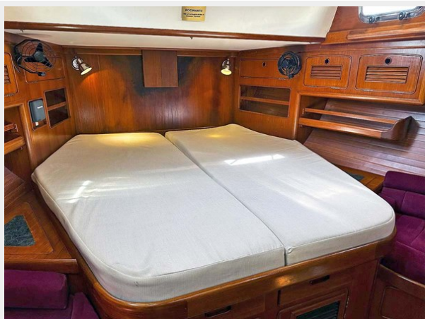
Owner's Cabin, Aft