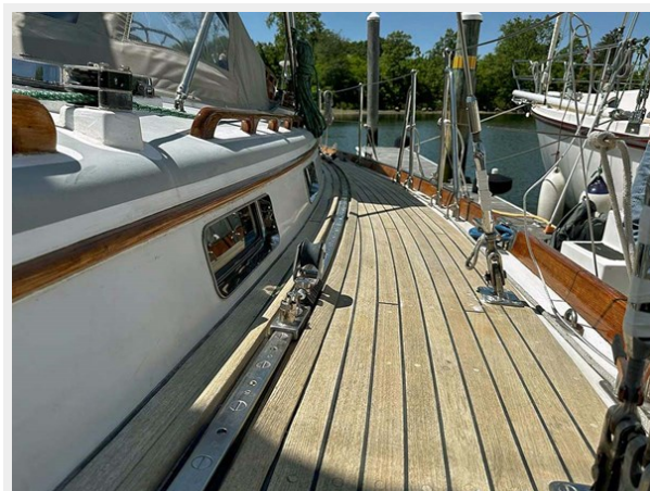
Port Deck, Looking Aft