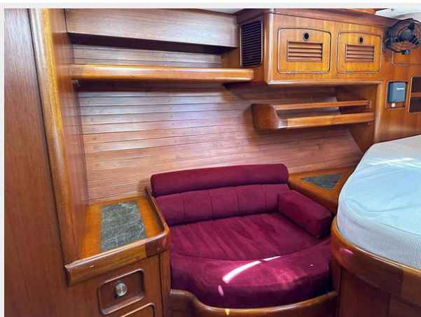
Aft Cabin, Stbd.