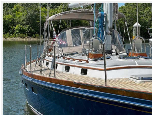
Stbd. Profile at Dock