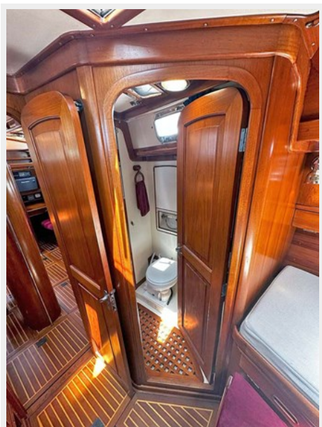
Fwd. Head from Berth