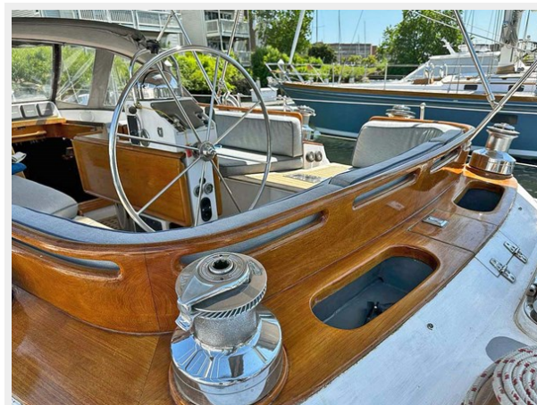
Cockpit Winches, Aft of Helm