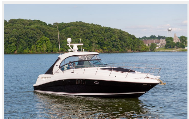
Stbd bow profile