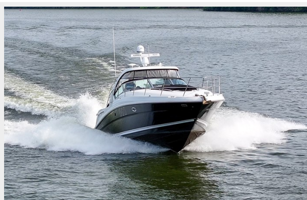
Stbd bow profile