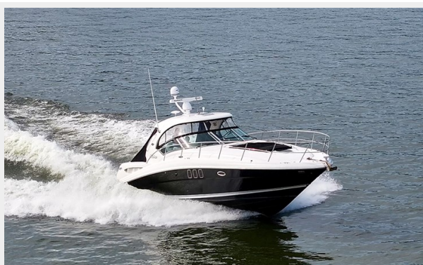
Stbd bow profile while underway