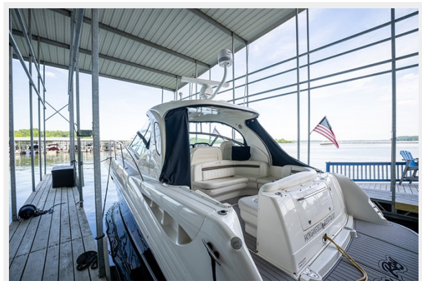
Cockpit view in slip