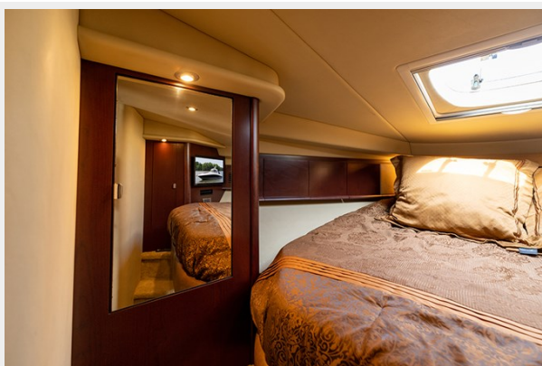
Port of fwd stateroom