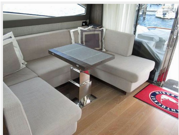
Salon U Settee Looking Aft