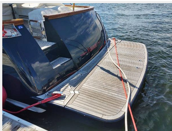
Swim Platform 'Up'