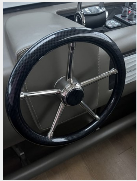
Carbon Fibre Wheel