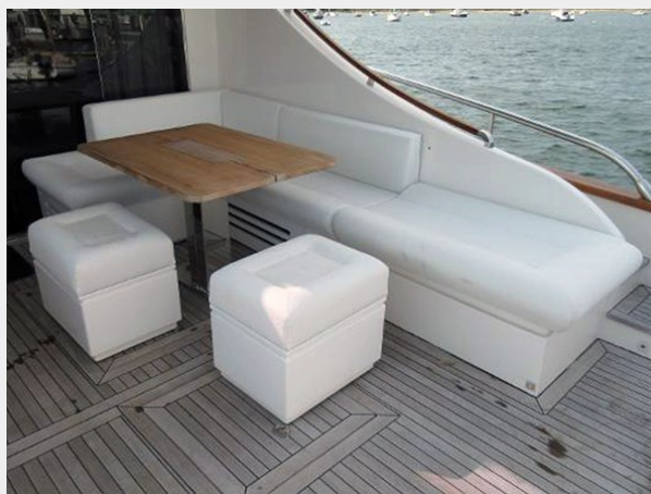
Cockpit L Settee