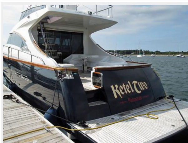
Port Quarter at Dock