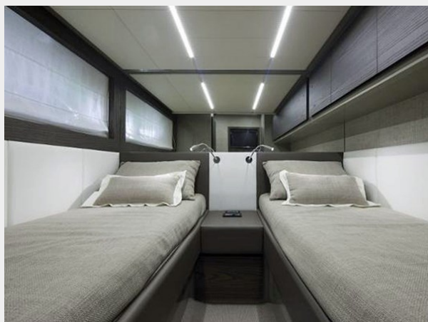
Starboard Guest Cabin Looking Aft