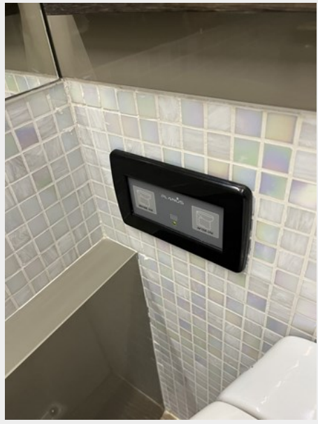
Head Tile Detail