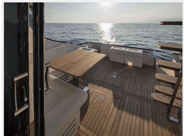
Cockpit Looking Aft from Salon