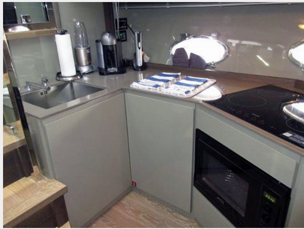
Galley Looking Aft