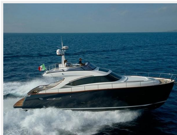
Starboard Beam Running Shot