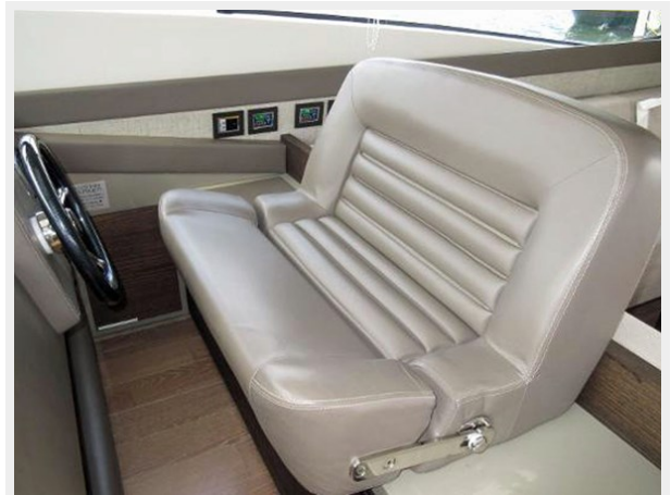
Helm Double Settee