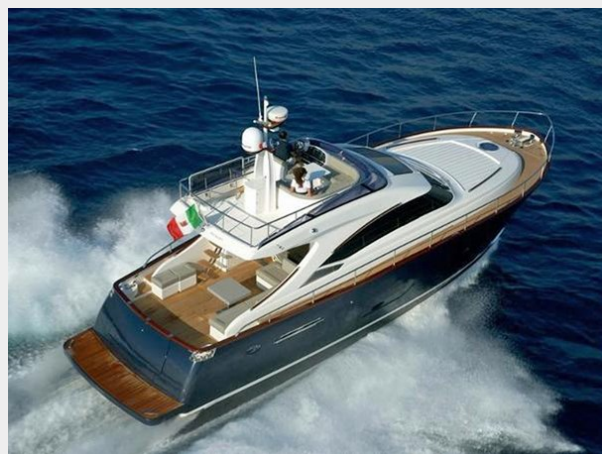
Starboard Quarter Running Shot