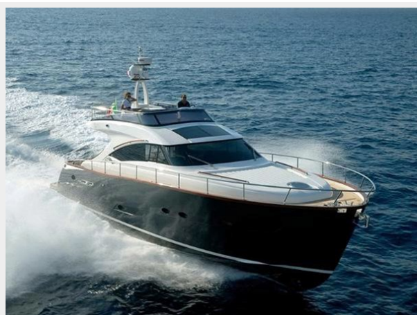
Starboard Bow Running Shot