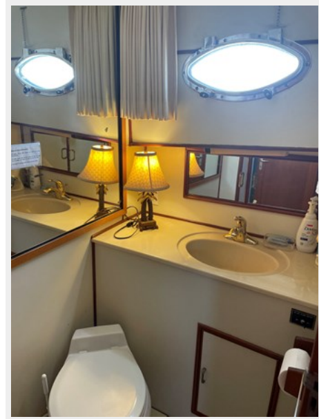
Bow Stateroom Head