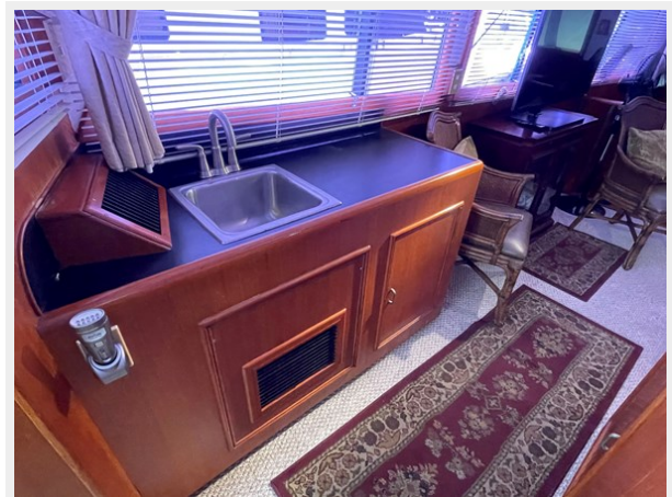
Illuminated Glassware Cabinet