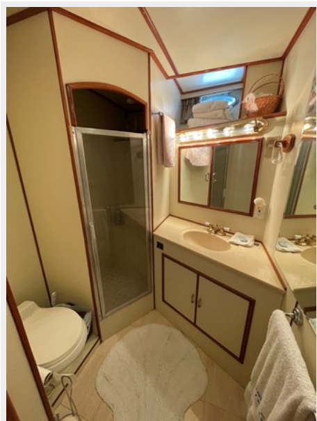
Shared Guest Head Forward