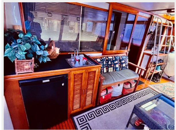
Enclosed Aft Deck