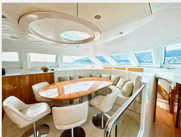
Kaiserwerft Baron 102 SEA BREEZE ONE 42