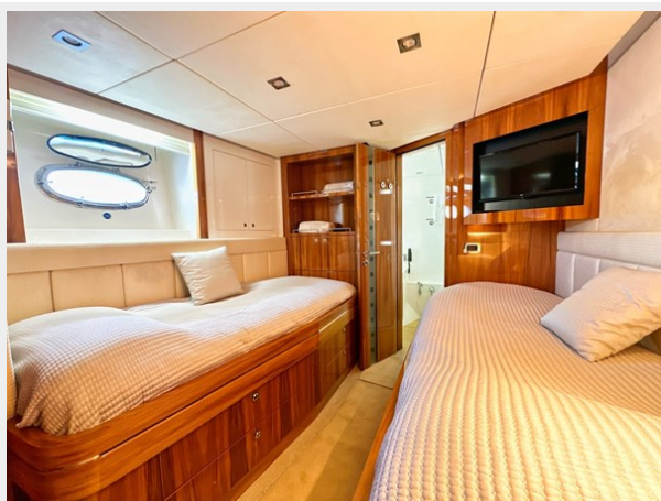
Kaiserwerft Baron 102 SEA BREEZE ONE 37