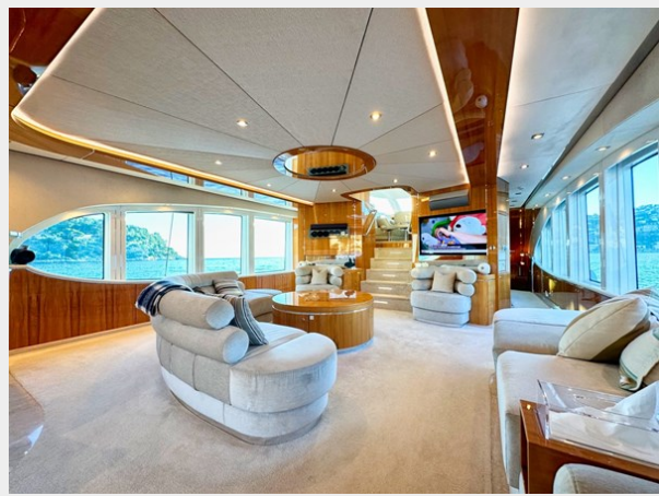
Kaiserwerft Baron 102 SEA BREEZE ONE 20