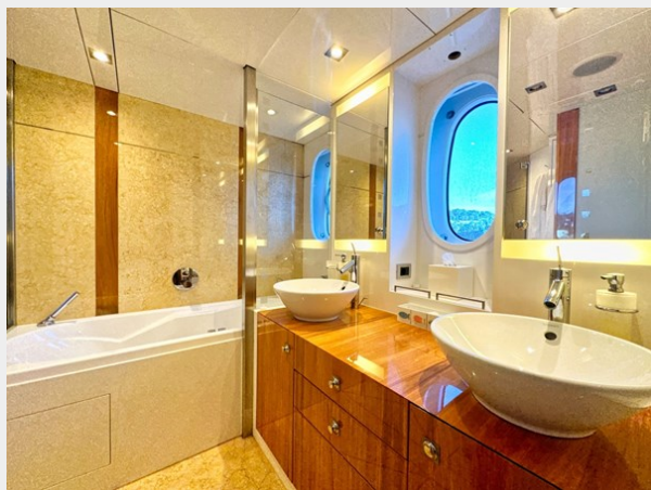
Kaiserwerft Baron 102 SEA BREEZE ONE 35