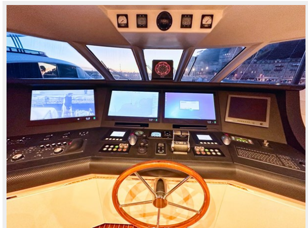
Kaiserwerft Baron 102 SEA BREEZE ONE 27