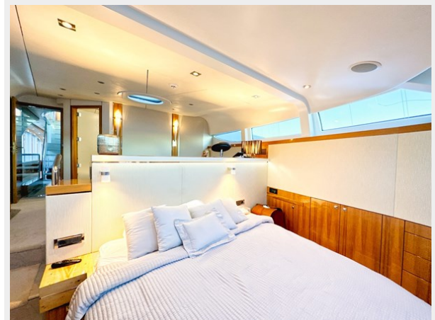
Kaiserwerft Baron 102 SEA BREEZE ONE 30