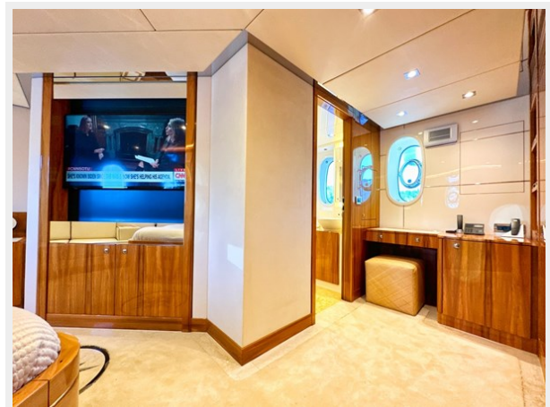
Kaiserwerft Baron 102 SEA BREEZE ONE 32