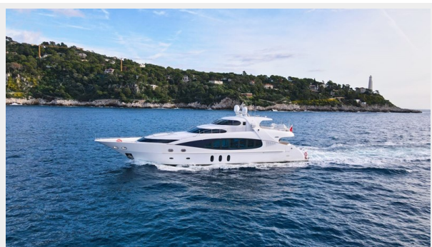
Kaiserwerft Baron 102 SEA BREEZE ONE 1 Kaiserwerft Baron 102 SEA BREEZE ONE 2