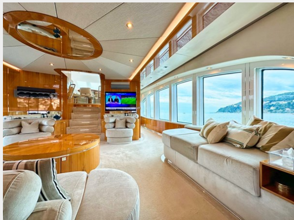
Kaiserwerft Baron 102 SEA BREEZE ONE 24