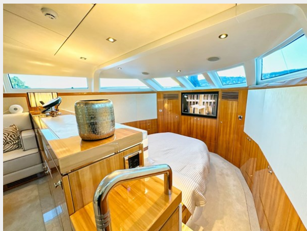
Kaiserwerft Baron 102 SEA BREEZE ONE 29