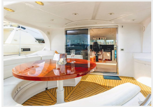
Kaiserwerft Baron 102 SEA BREEZE ONE 15