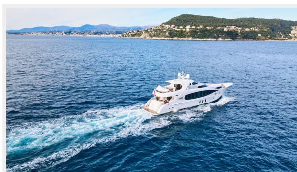
Kaiserwerft Baron 102 SEA BREEZE ONE 6 Kaiserwerft Baron 102 SEA BREEZE ONE 7