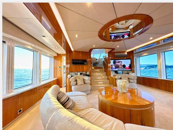
Kaiserwerft Baron 102 SEA BREEZE ONE 22