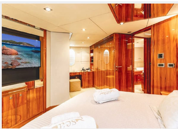
Kaiserwerft Baron 102 SEA BREEZE ONE 33