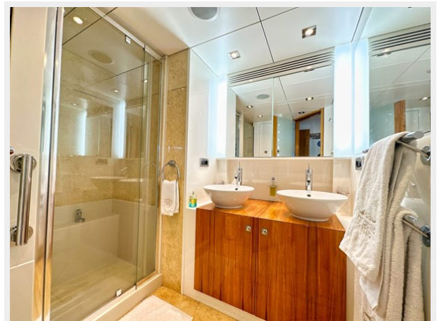
Kaiserwerft Baron 102 SEA BREEZE ONE 38