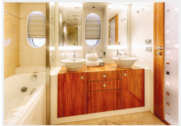
Kaiserwerft Baron 102 SEA BREEZE ONE 36