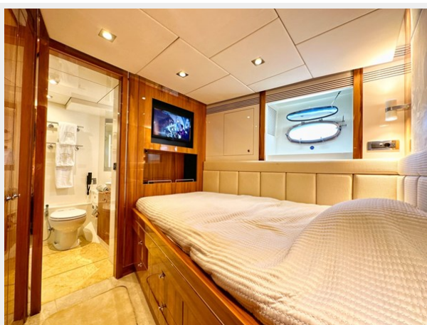
Kaiserwerft Baron 102 SEA BREEZE ONE 39