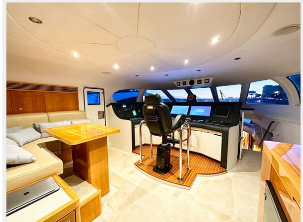
Kaiserwerft Baron 102 SEA BREEZE ONE 25