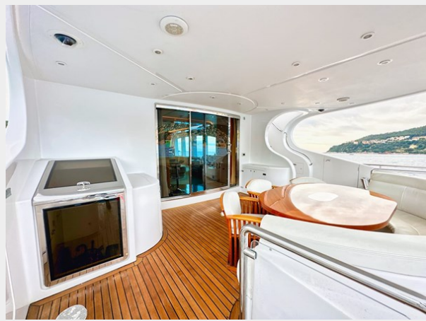
Kaiserwerft Baron 102 SEA BREEZE ONE 14