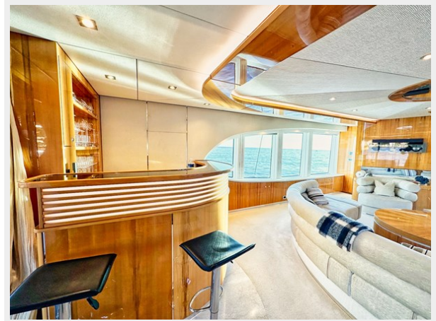
Kaiserwerft Baron 102 SEA BREEZE ONE 21