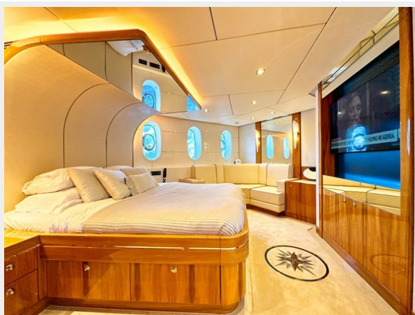
Kaiserwerft Baron 102 SEA BREEZE ONE 31