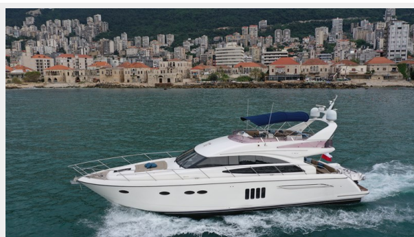
Princess 62 Under Way