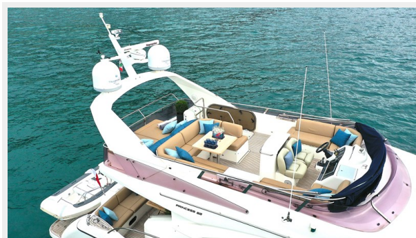
Princess 62 Flybridge