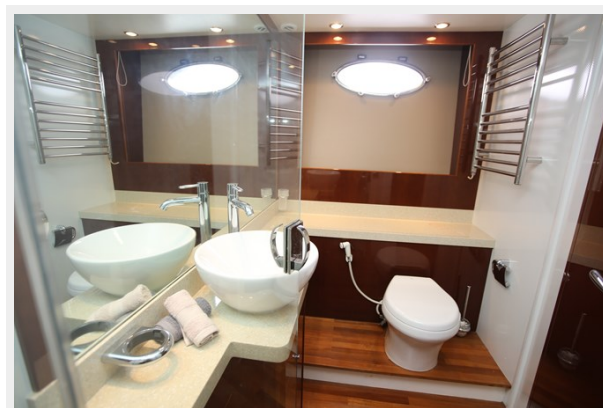
Princess 62 Master En Suite