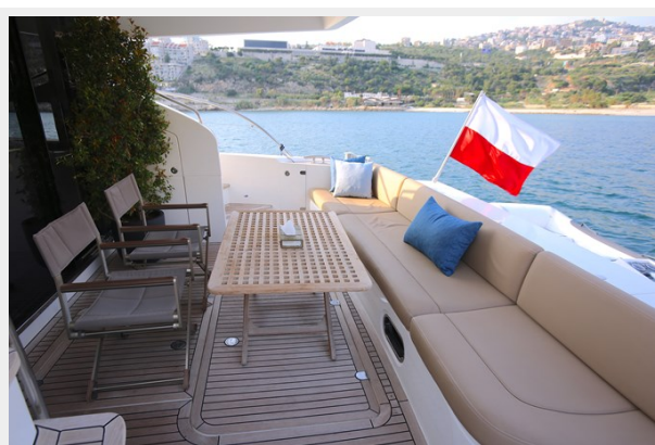
Princess 62 Cockpit