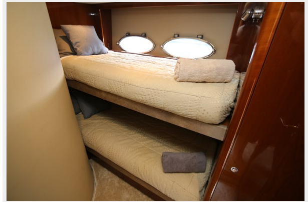
Princess 62 Fourth Cabin