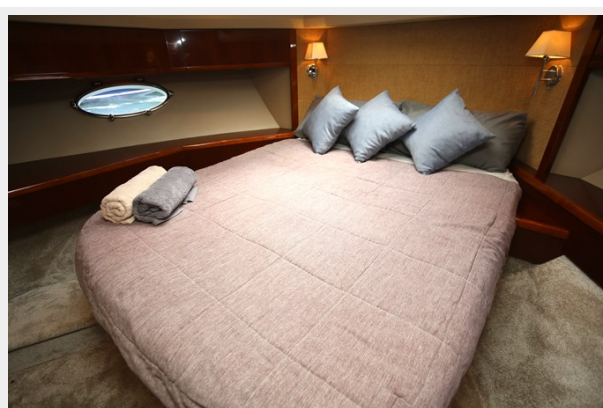
Princess 62 VIP Forward