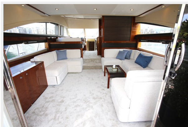
Princess 62 Salon