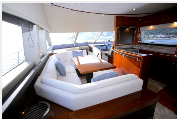
Princess 62 Dinette