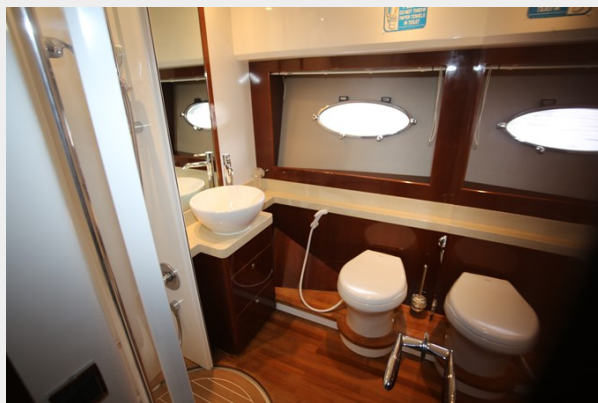
Princess 62 Guest Heads