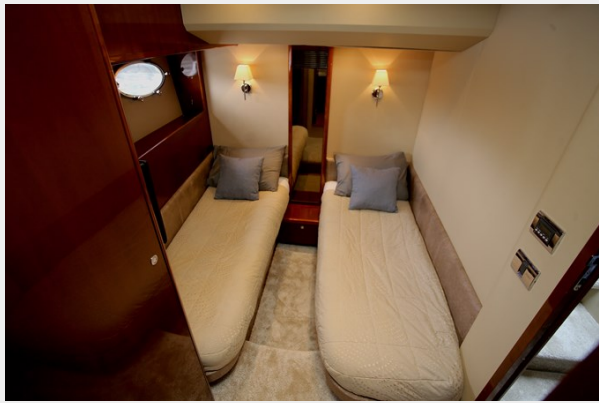
Princess 62 Third Cabin