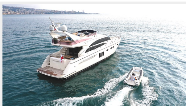
Princess 62 on Anchor