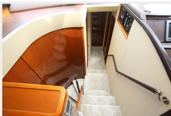
Princess 62 Stairwell