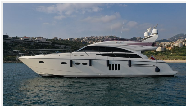
Princess 62 On Anchor