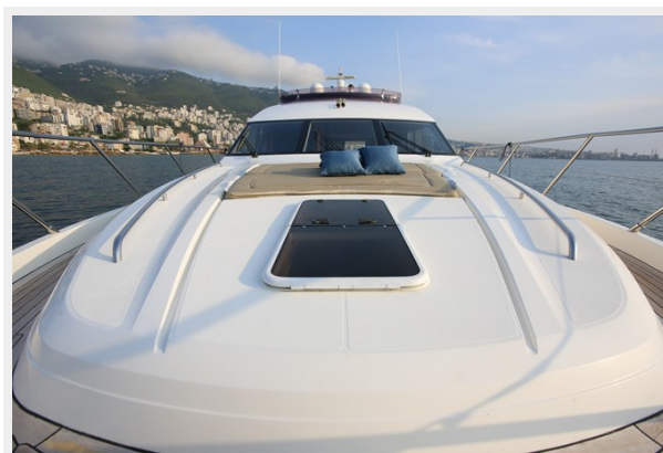
Princess 62 Bow Sunlounging