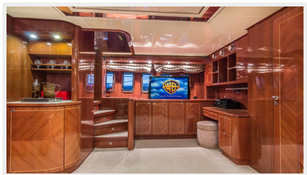
009 DOLCE_VITA_main salon -56