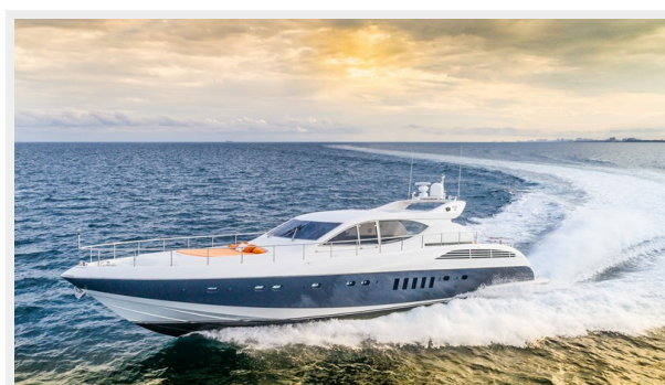
042 DOLCE_VITA_port running -47