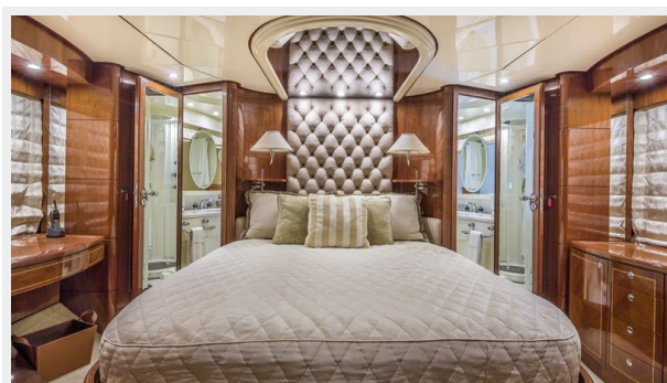
011 DOLCE_VITA_master stateroom -28