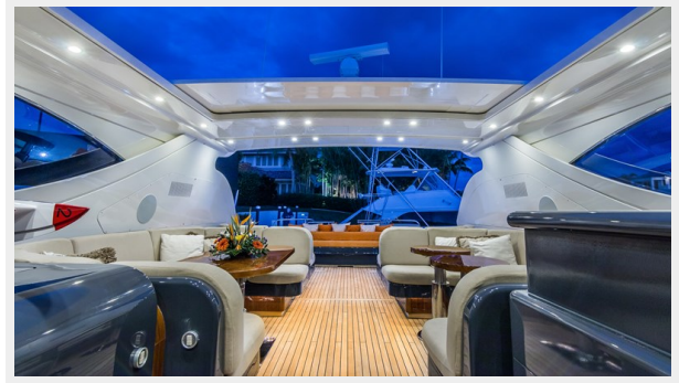
006 DOLCE_VITA_upper deck lounge -62