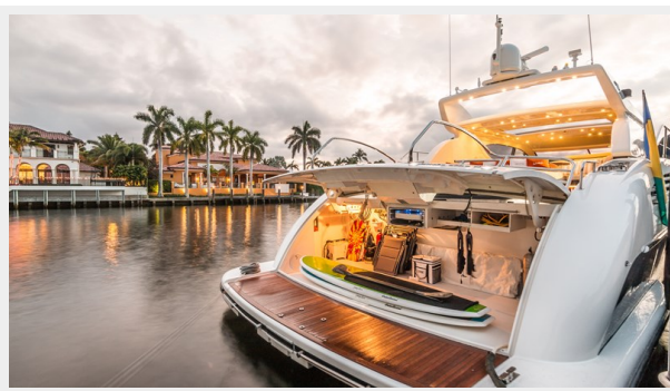
035 DOLCE_VITA_garage -58