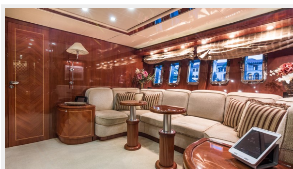
008 DOLCE_VITA_main salon -55