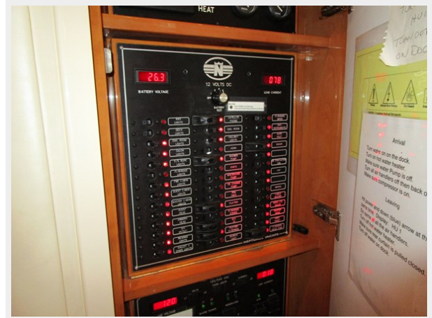
Companionway DC Panel