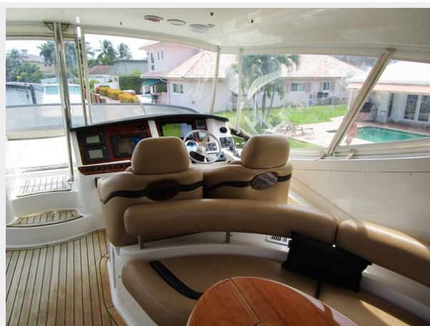
Flybridge Looking Forward