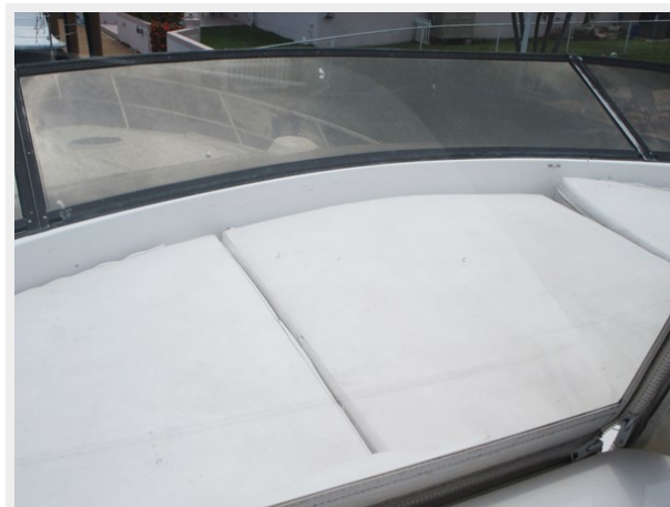
Forward Exterior Seating