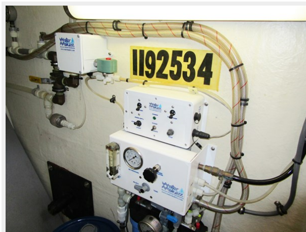
New Laz Water Maker