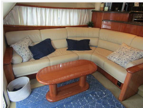
Salon to Port