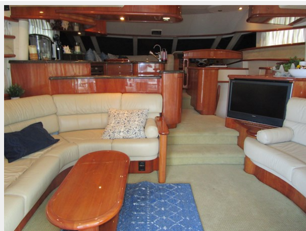
Salon Looking Forward