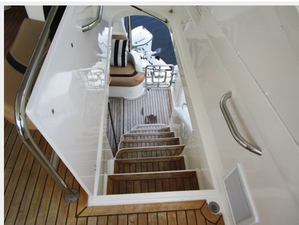
Steps to Flybridge