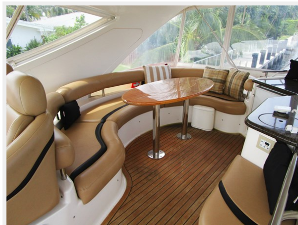
Flybridge Starboard Side