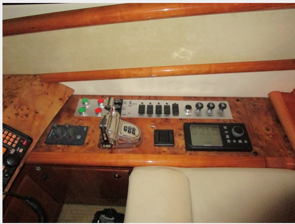
Lower Helm Outboard