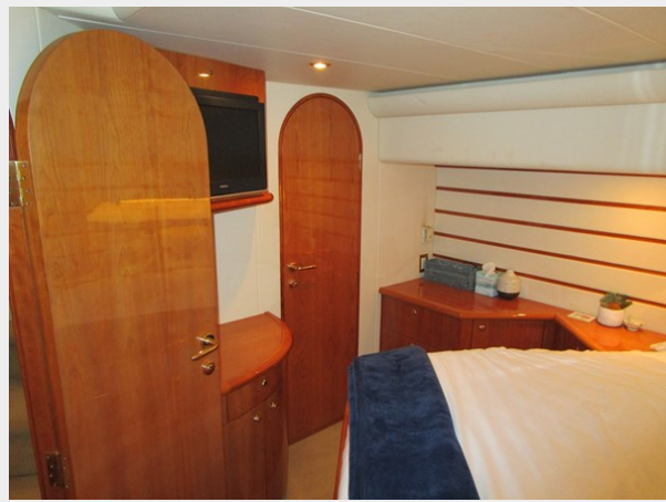
Master to Stbd.