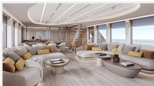
Living Room 4