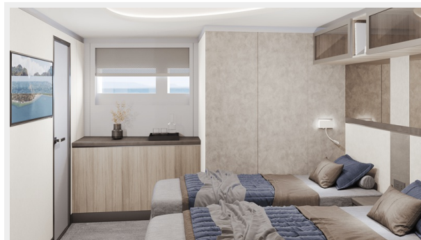
Guest Stateroom_Twin Bed 1