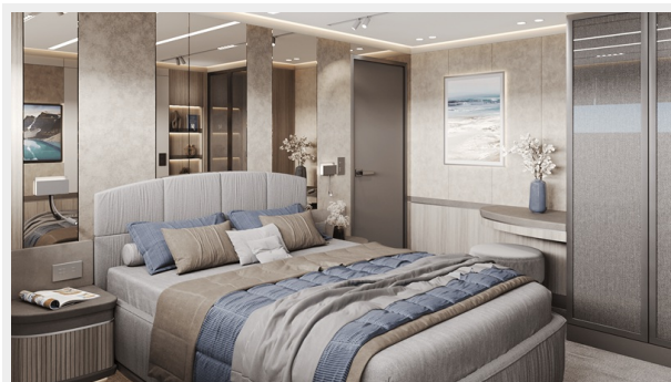
Guest Stateroom_French Bed 2