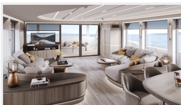
Living Room 1