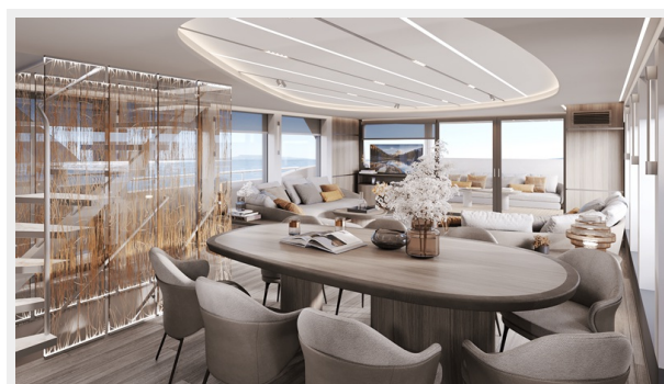
Living Room 3