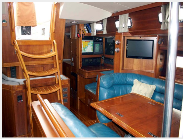
Salon Aft, Nav Area