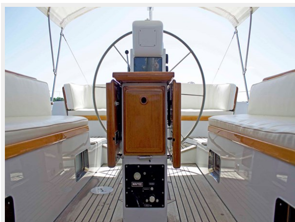
Cockpit, Looking Aft