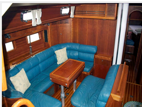
Salon Table Folded