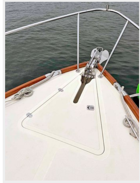
Foredeck Flush Anchor Locker