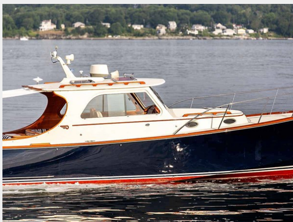
Pilothouse Starboard Beam