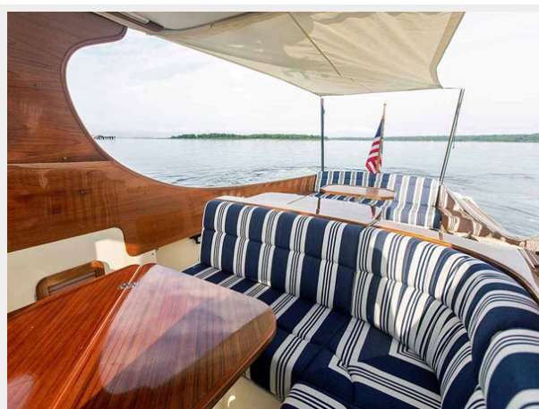
L Settee and Awning