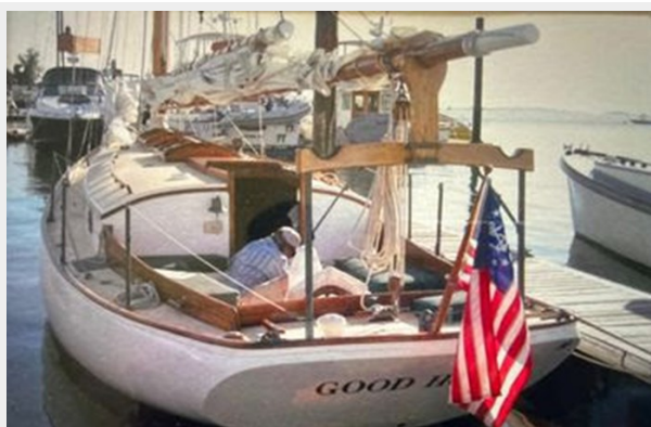
Cockpit view 2, dockside