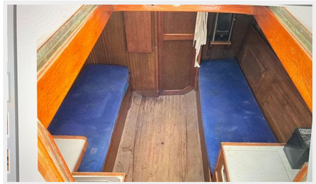
Settee/berths in main cabin