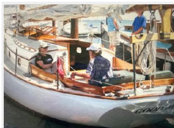
Cockpit view, dockside