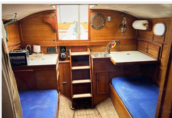
Aft cabin, galley to port, nav station to starboard