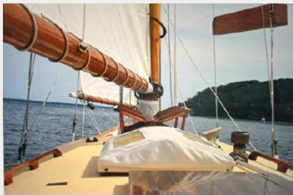
cabin top butterfly hatch & cover under sail