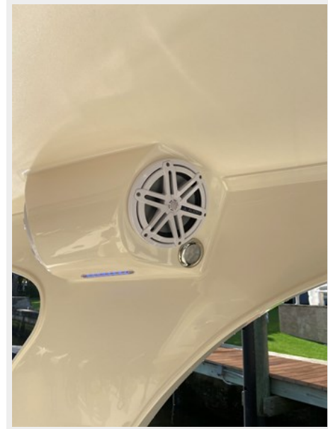
IMG_7423 helm speakers