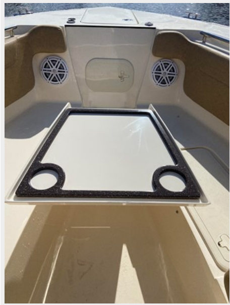
IMG_7424 forward table