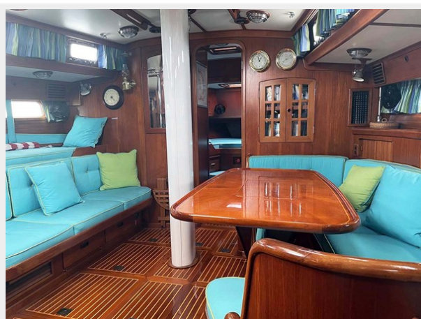
Main Salon, Fwd.