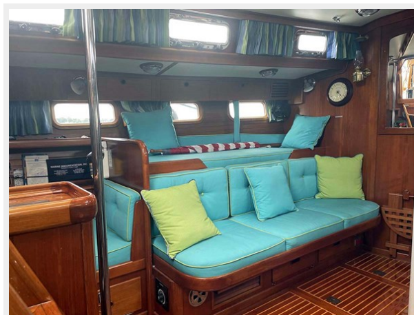
Main Salon, Port