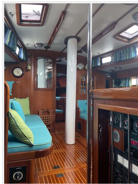
Port Salon, across from Nav