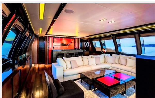
salon fwd view