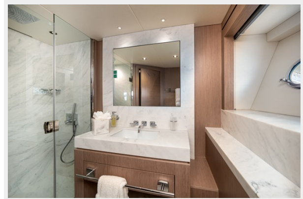
VIP EN SUITE