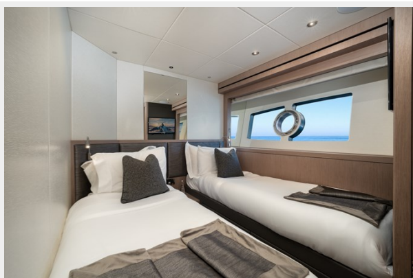
DOUBLE GUEST CABIN