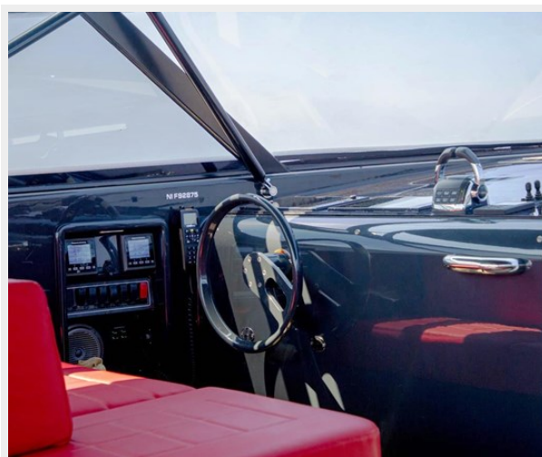
2013 VANDUCTCH 55_10.spec