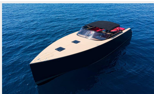
2013 VANDUCTCH 55_3.spec