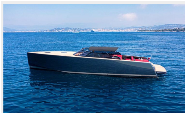
2013 VANDUCTCH 55_4.spec