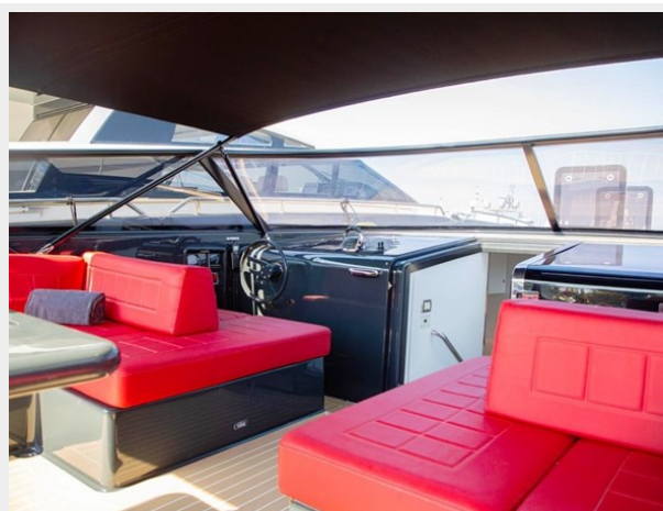
2013 VANDUCTCH 55_9.spec