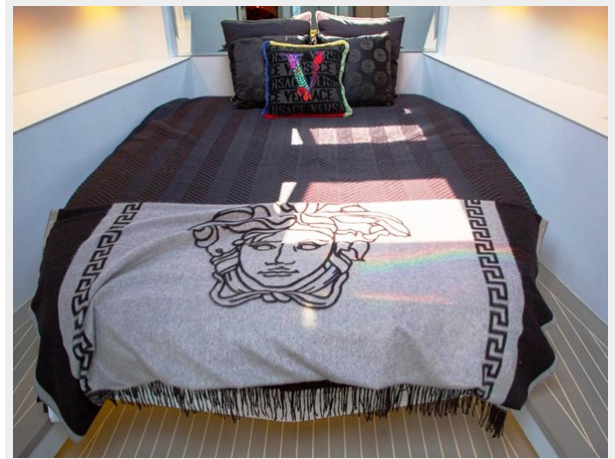
2013 VANDUCTCH 55_14.spec