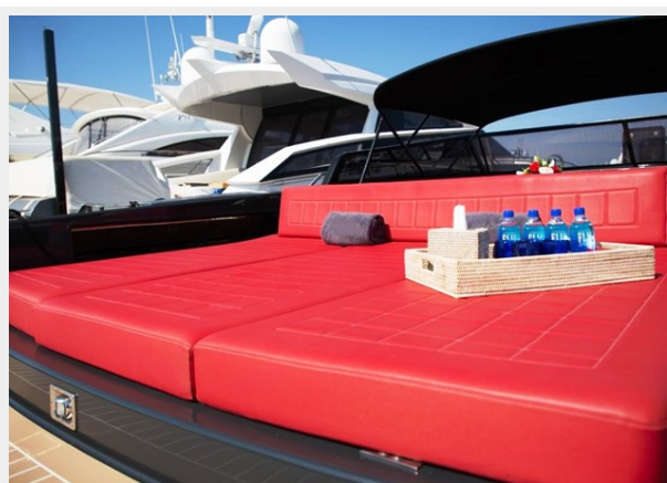
2013 VANDUCTCH 55_5.spec