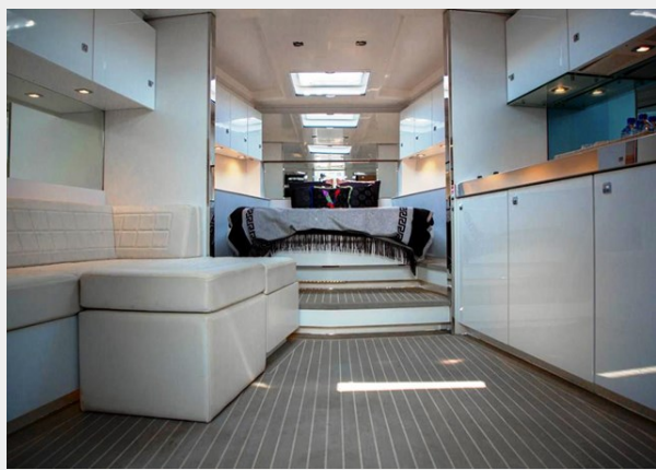
2013 VANDUCTCH 55_13.spec