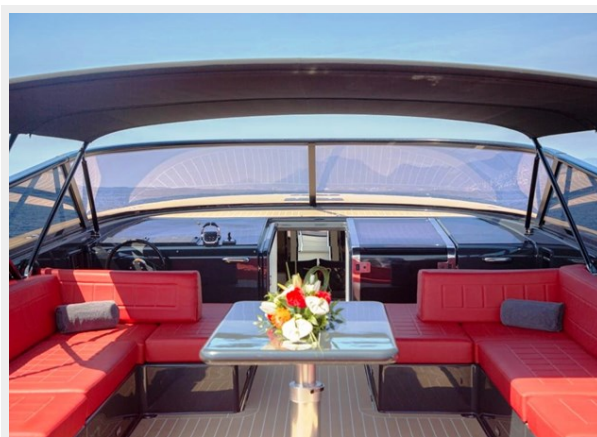
2013 VANDUCTCH 55_8.spec