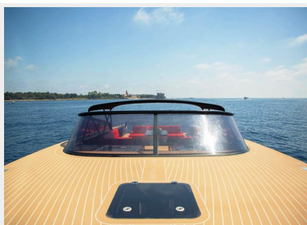
2013 VANDUCTCH 55_11.spec