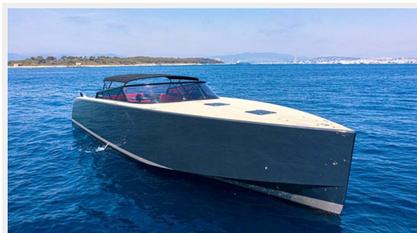
2013 VANDUCTCH 55_2.spec