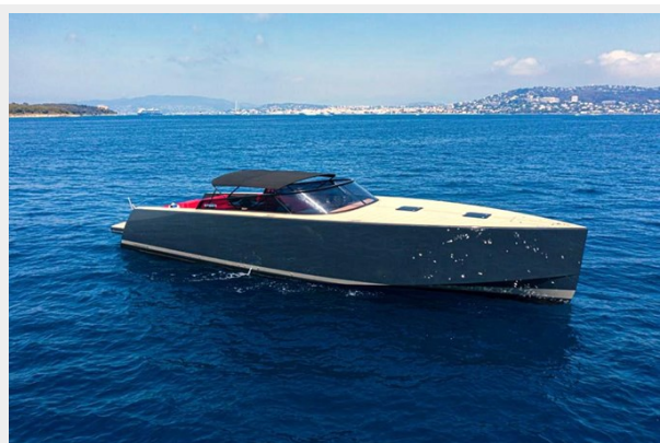
2013 VANDUCTCH 55_1.spec