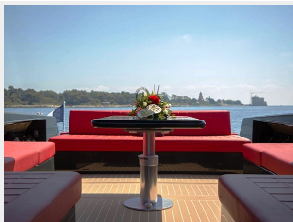
2013 VANDUCTCH 55_7.spec