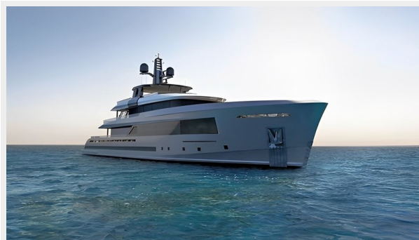
INACE AVENTURA 164 - 2025 MOTOR YACHT FOR SALE | EXTERIOR (3)