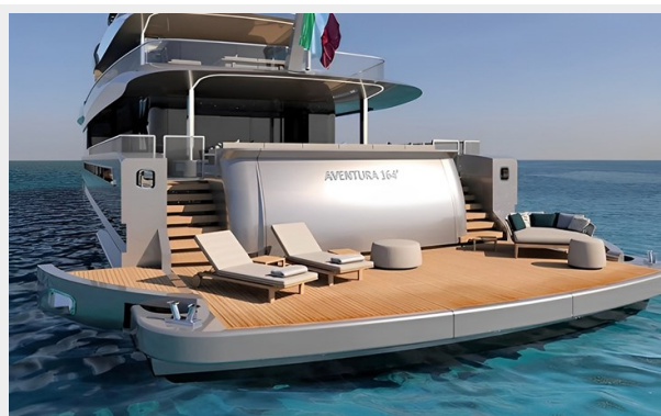
INACE AVENTURA 164 - 2025 MOTOR YACHT FOR SALE | EXTERIOR (4)