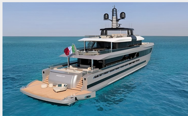
INACE AVENTURA 164 - 2025 MOTOR YACHT FOR SALE | EXTERIOR (2)