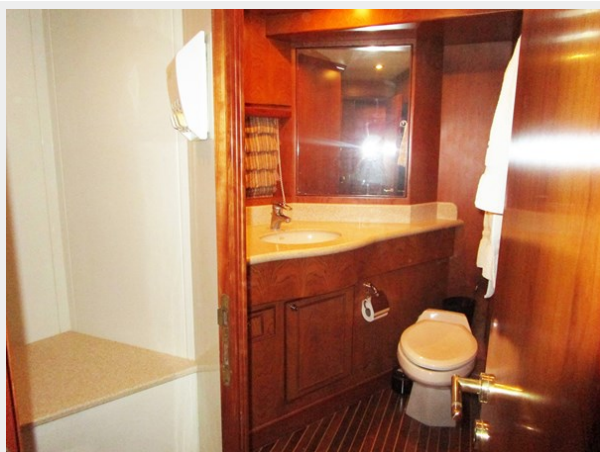
Port Side Crew Head