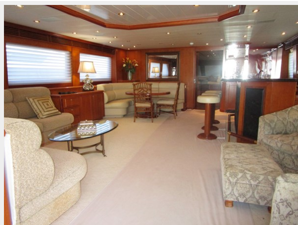
Salon Looking Forward