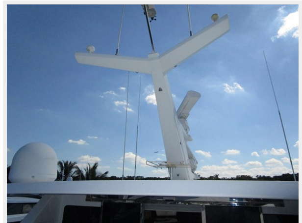
Coach Roof Equipment