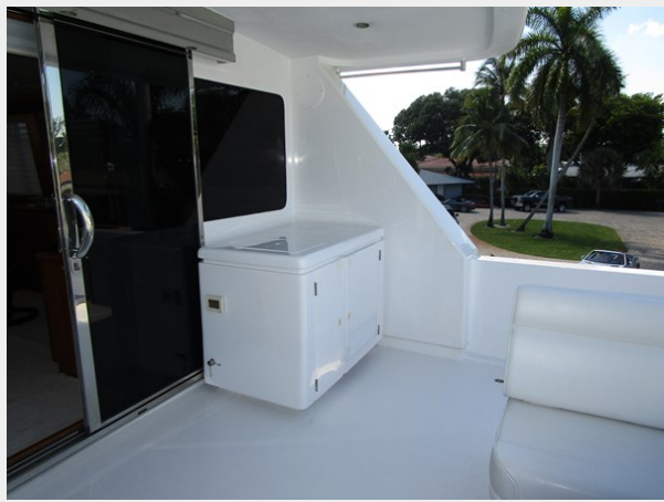
Boat Deck Storage