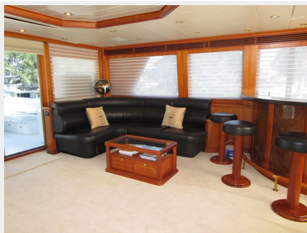
Skylounge to Port