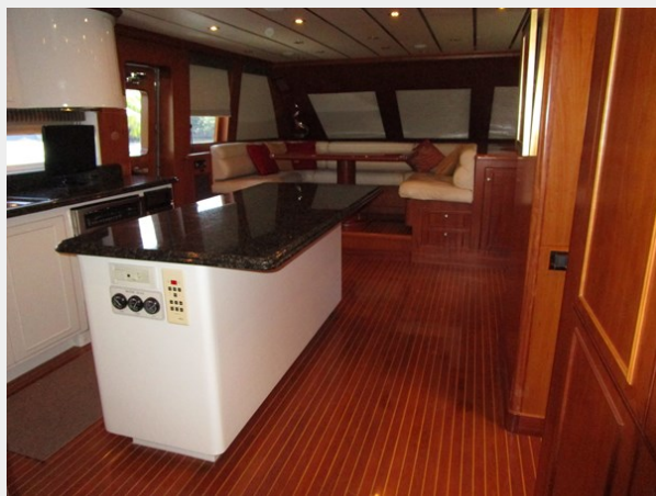
Galley Looking Forward