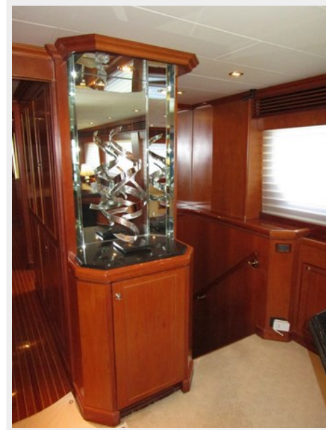
Salon to Stbd Forward