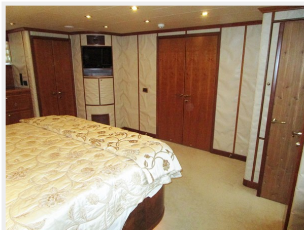
Master Port Forward