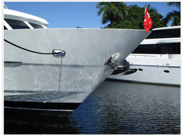
Twin Anchor Detail