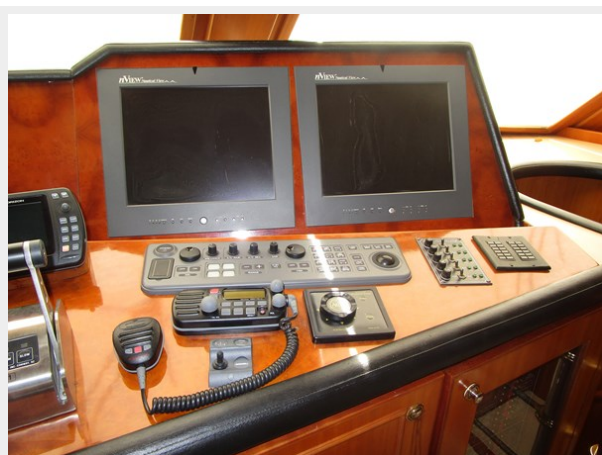
Helm Detail Port