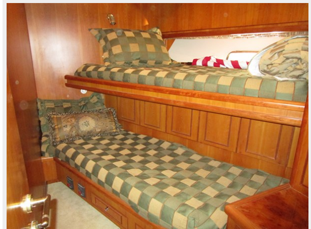
Stbd Side Crew