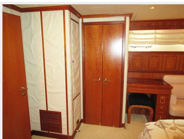
Master Starboard Forward