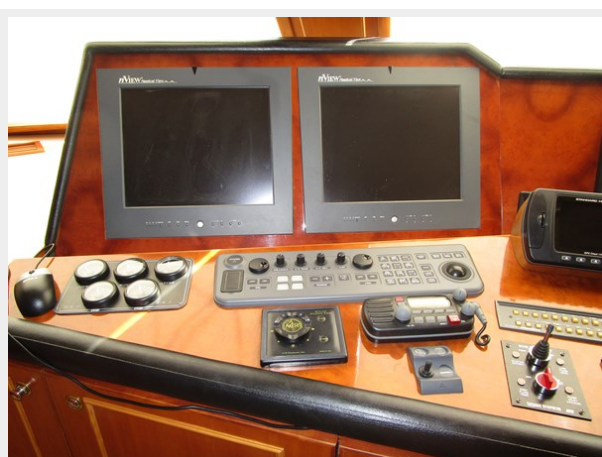
Helm Detail Starboard