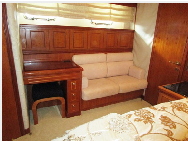
Master to Stbd