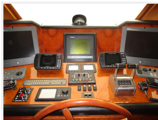
Helm Detail Center