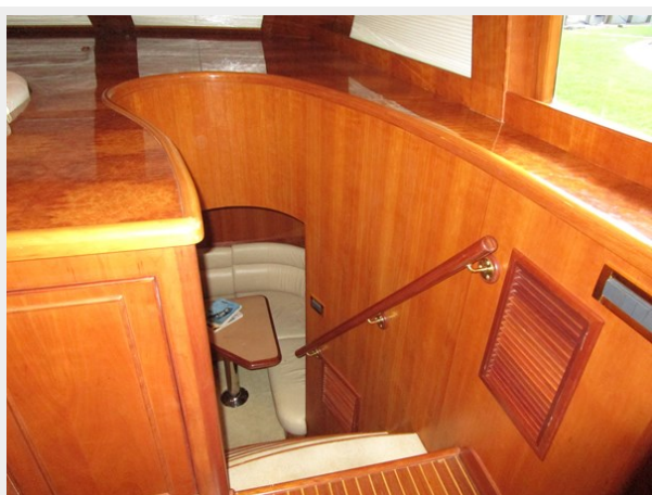
Crew Area Steps Aft Galley