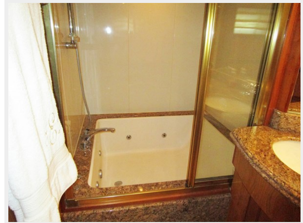
Master Tub Shower