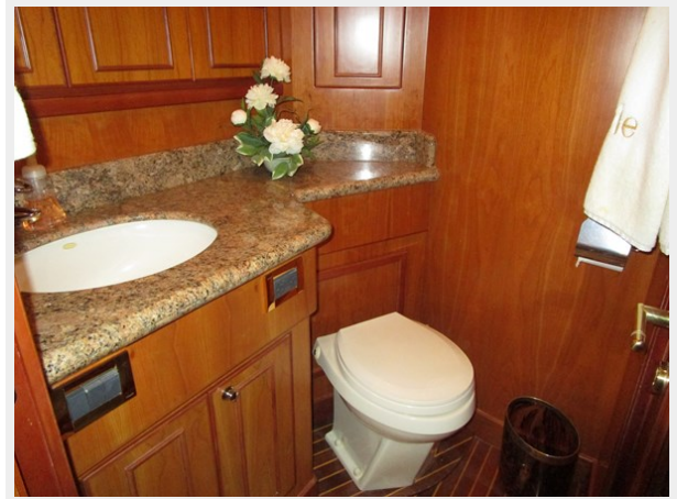
Stbd Guest Head