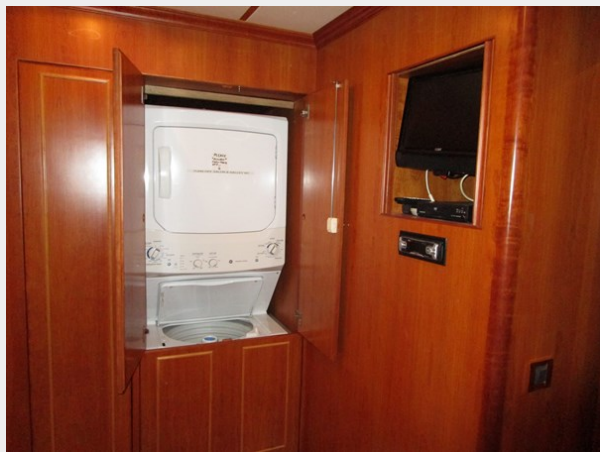
Crew Area Laundry