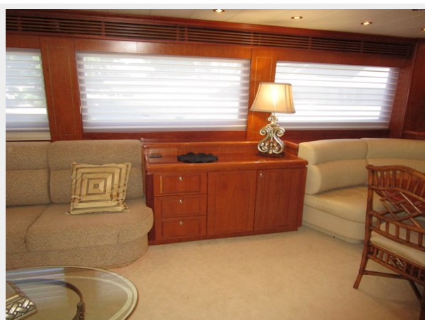
Salon to Port Middle