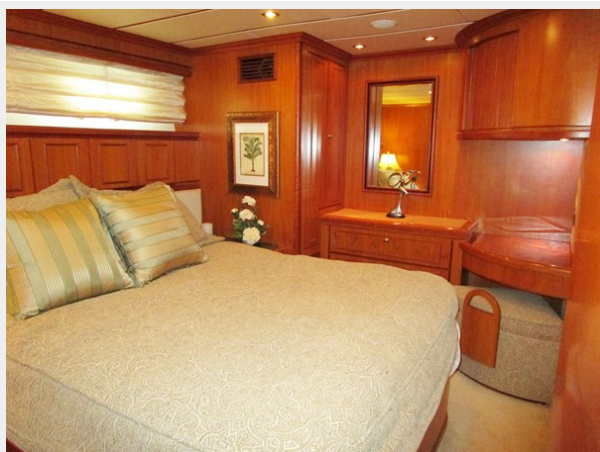
Port Side Guest Looking Forward