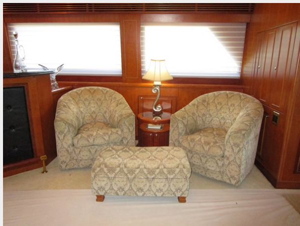
Salon to Stbd Aft