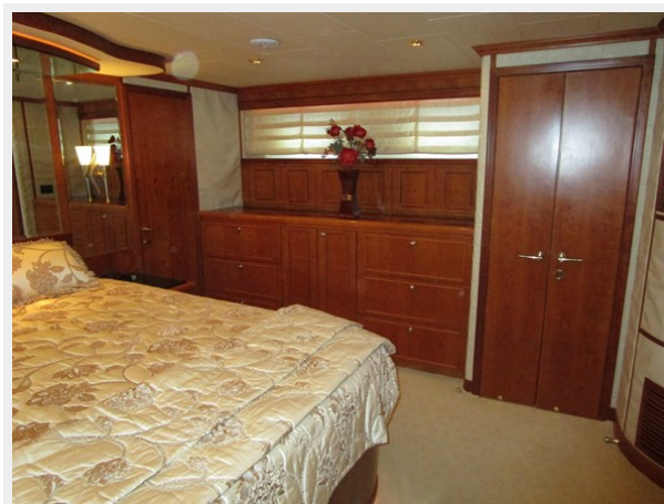
Master to Port