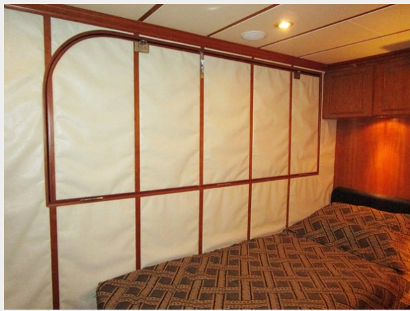
Stbd Side Cabin Pullman