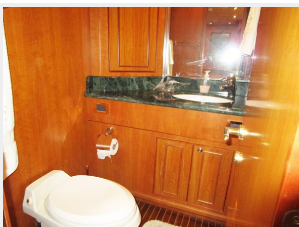
Port Side Guest Cabin Head