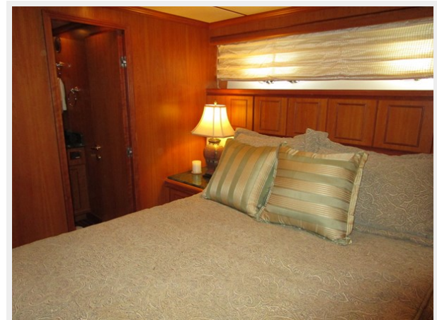
Port Side Guest Looking Aft