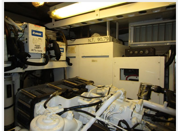
45 KW Generator