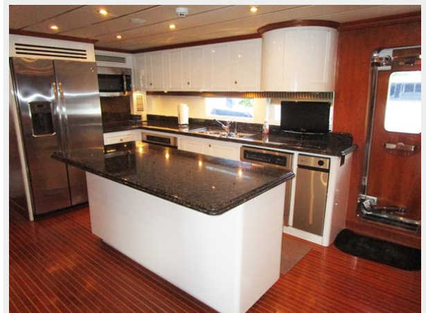
Galley Looking Aft