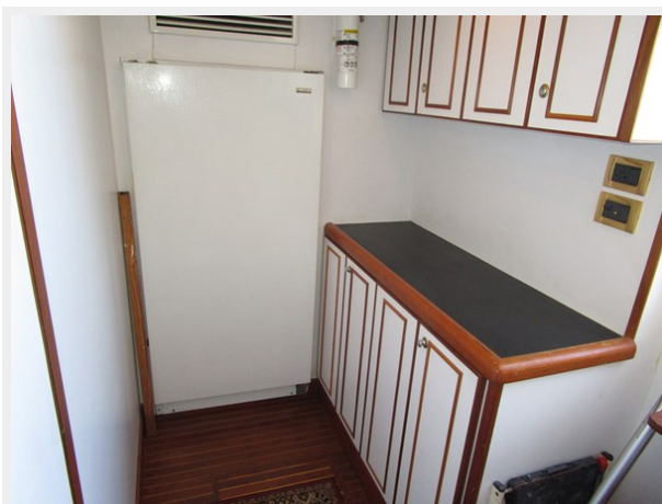
Lazarette to Stbd