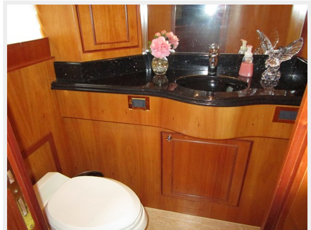
Main Deck Day Head