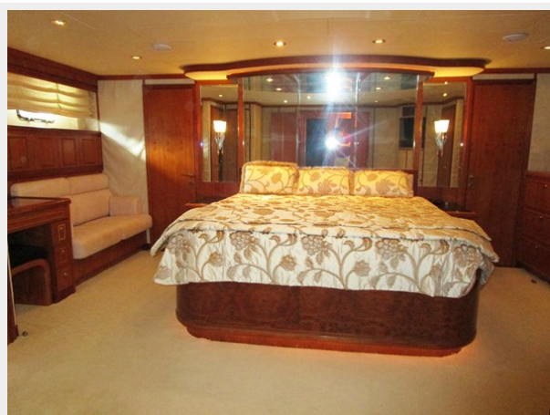
Master Looking Aft