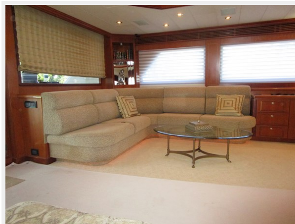
Salon to Port Aft