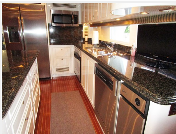
Galley to Port