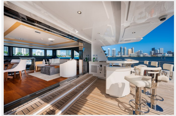
Bridge Deck Aft