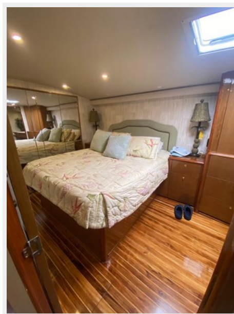
WhatsApp Image 2023-09-29 at 11.13.35 AM WhatsApp Image 2023-09-29 at 11.13.35 AM