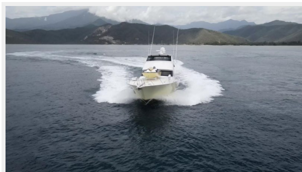
WhatsApp Image 2023-09-29 at 11.13.36 AM