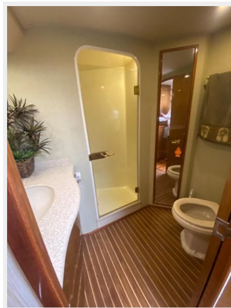
WhatsApp Image 2023-09-29 at 11.13.36 AM (1) WhatsApp Image 2023-09-29 at 11.13.36 AM