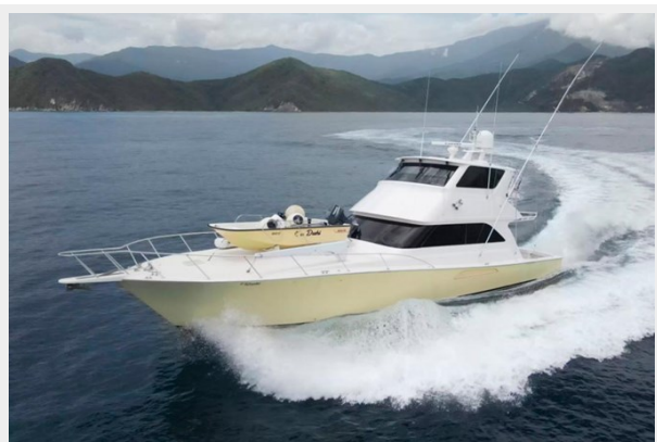
WhatsApp Image 2023-09-29 at 11.13.34 AM