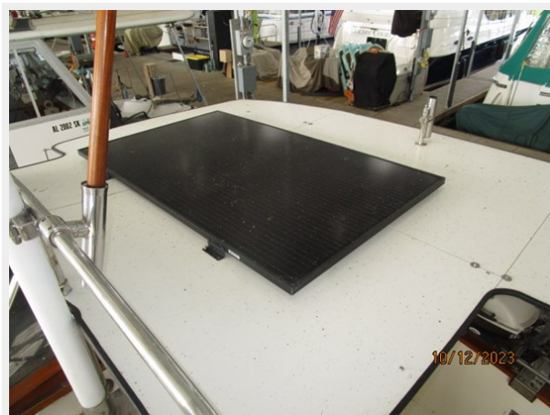
Pipe Dream aft solar panel 10-12-23