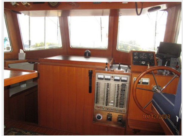
Pipe Dream pilothouse fwd 10-12-23