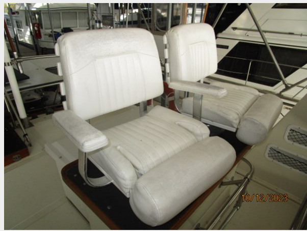
Pipe Dream flybridge helmseats 10-12-23