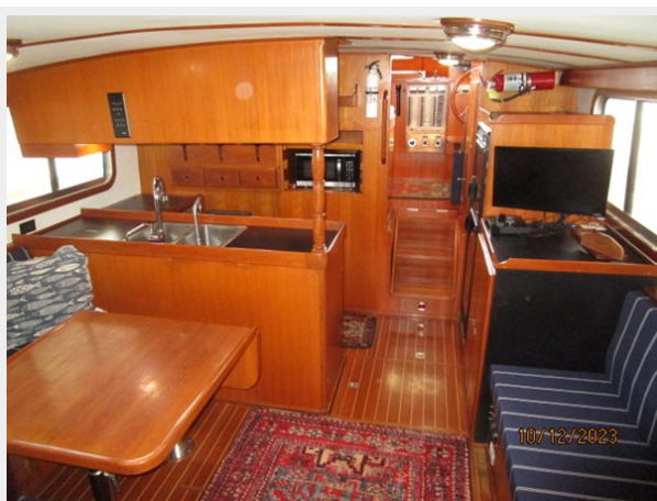
Pipe Dream salon fwd 10-12-23