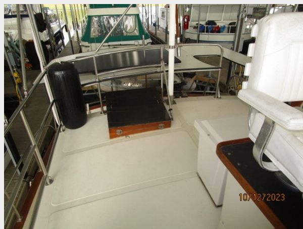
Pipe Dream flybridge aft 10-12-23