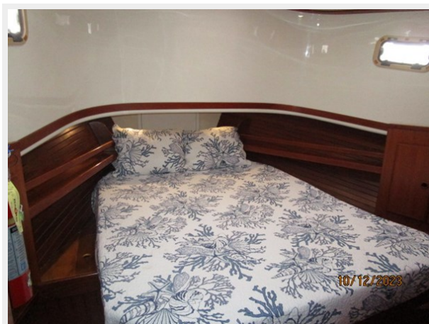
Pipe Dream stateroom 10-12-23