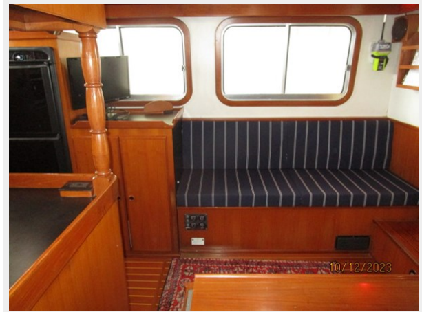
Pipe Dream salon stbd 10-12-23