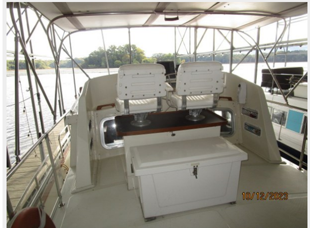
Pipe Dream flybridge fwd 10-12-23