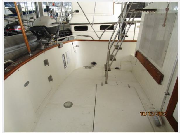
Pipe Dream aftdeck port 10-12-23