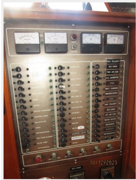
Pipe Dream electrical panel 10-12-23