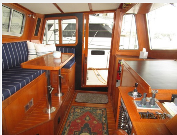
pipe Dream pilothouse port 10-12-23