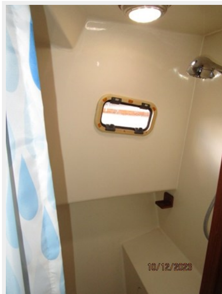
Pipe Dream shower 10-12-23