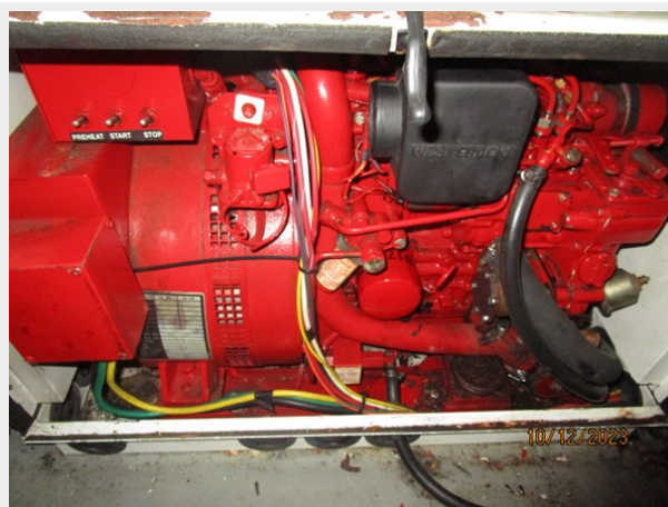
Pipe Dream generator 10-12-23