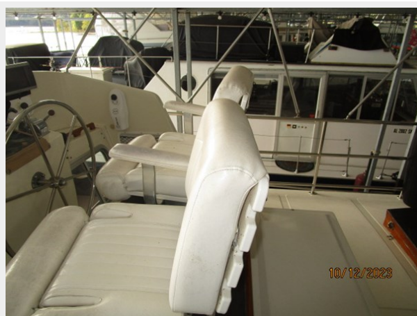
Pipe Dream flybridge stbd 10-12-23