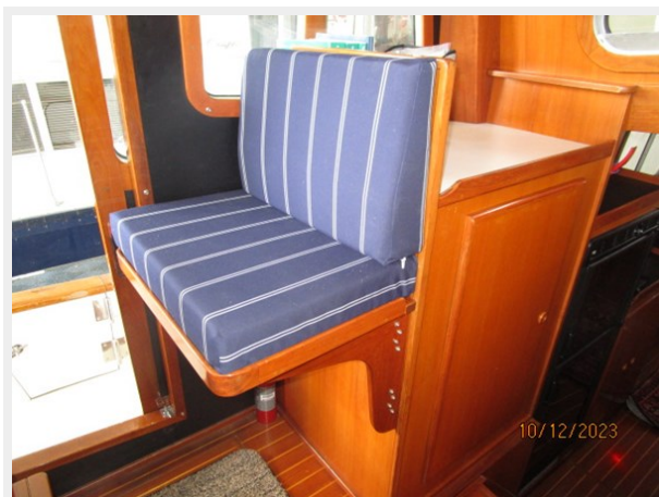
Pipe Dream pilothouse helmseat 10-12-23