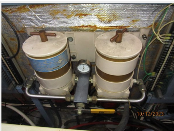
Pipe Dream Racor fuel filters 10-12-23