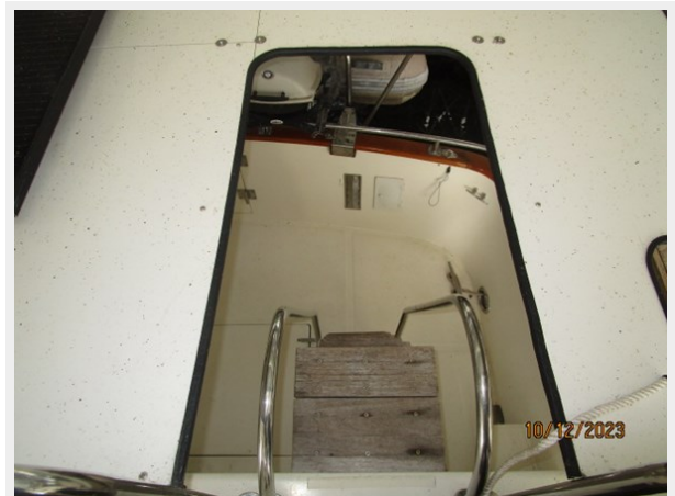
Pipe Dream flybridge-aftdeck ladder 10-12-23