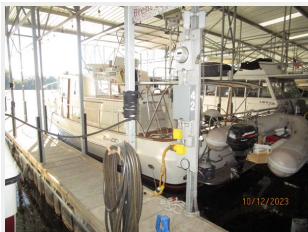
Pipe Dream port aft profile 10-12-23