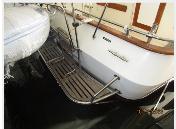
Pipe Dream swimplatform 10-12-23