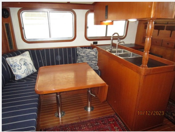
Pipe Dream salon port 10-12-23