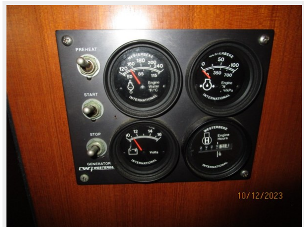
Pipe Dream generator panel 10-12-23