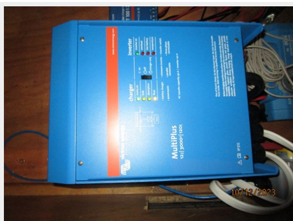
Pipe Dream inverter 10-12-23