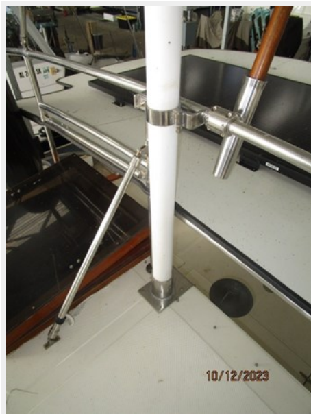
Pipe Dream mast base 10-12-23