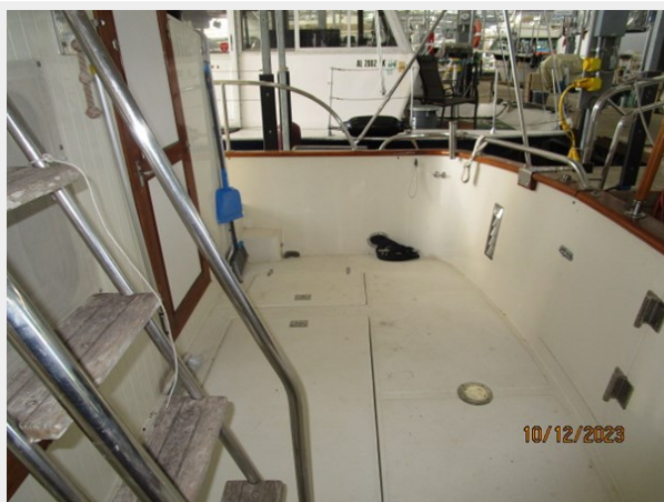
Pipe Dream aftdeck stbd 10-12-23