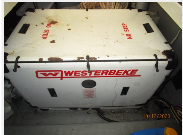
Pipe Dream generator soundbox 10-12-23