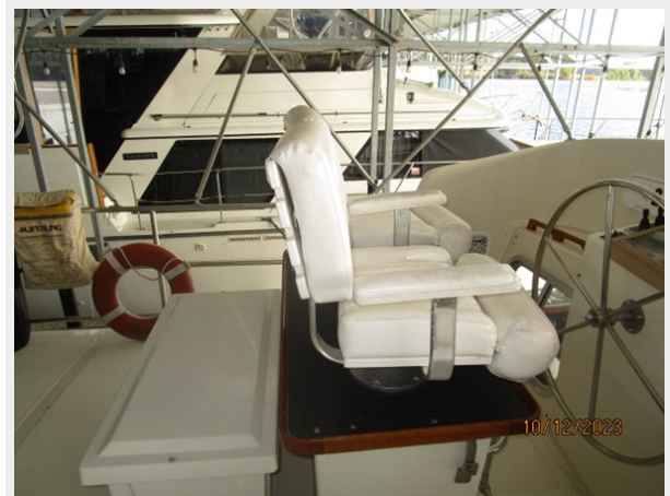
Pipe Dream flybridge port 10-12-23