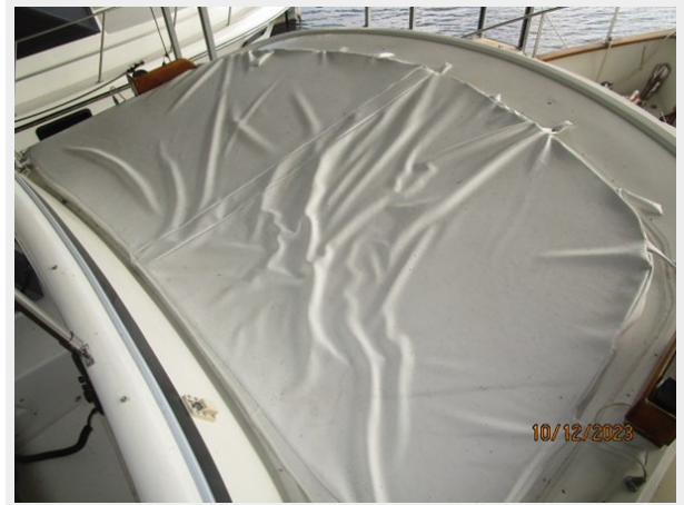
Pipe Dream flybridge sunpad 10-12-23