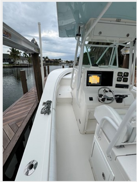
Port side deck looking fwd