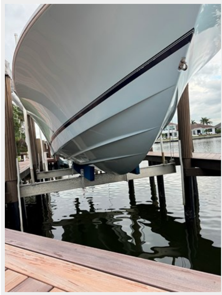
Stbd bottom hull