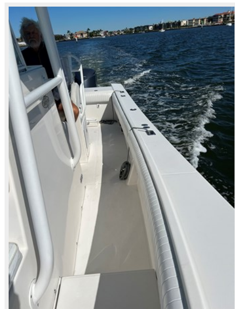
Port side deck looking aft