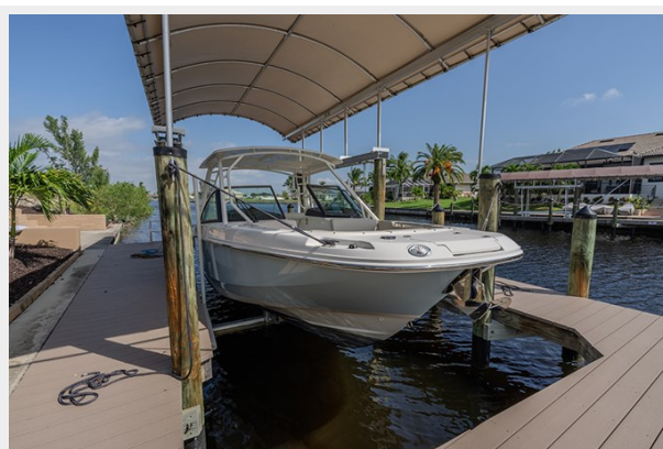
Stbd bow profile (in slip)