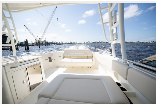
Cockpit looking aft