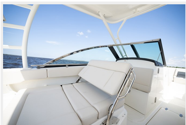
Companion seat with adjustable backrest