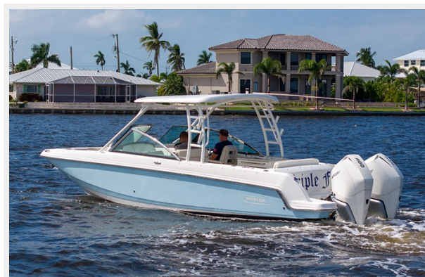
Port quarter profile