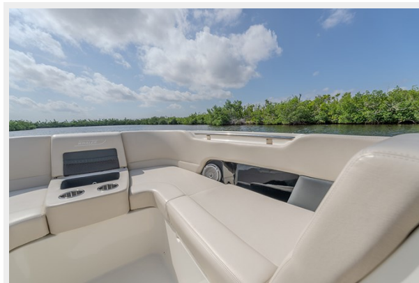
Stbd bow seating area