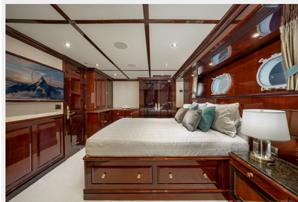
Guest Stateroom 2