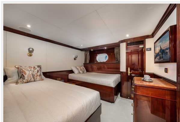
Guest Stateroom 4