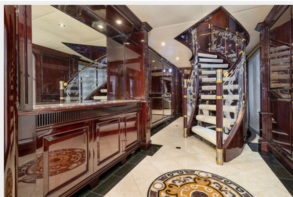
Staircase to Guest Staterooms/Foyer