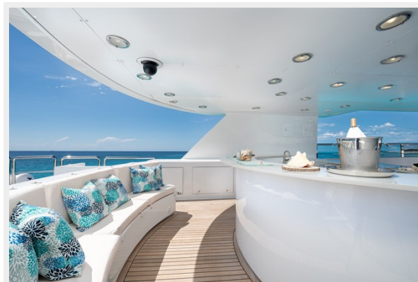
Sun Deck Bar Area