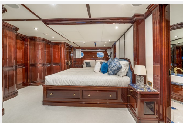
Guest Stateroom 3