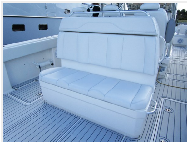
Aft Console Seat