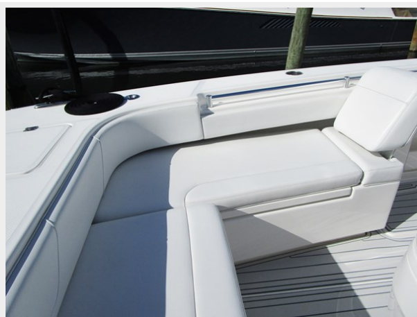
Stbd. Side Bow Seat