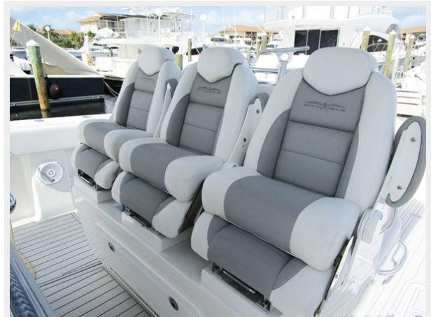
Llebroc Helm Seats