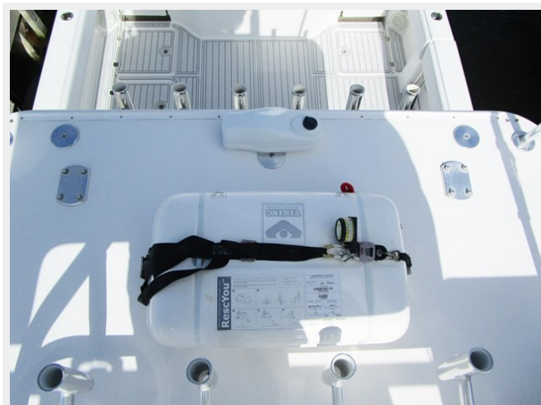
Tower View Aft