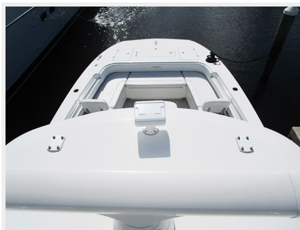
Tower View Forward