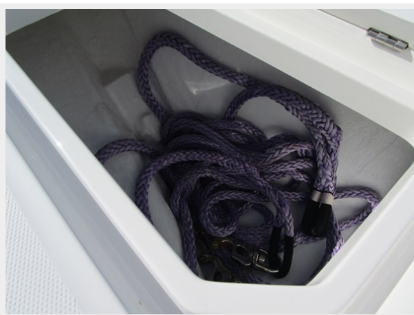
Stbd. Bow Hatch with Tow Bridle