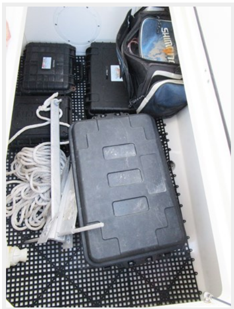
Under Deck Storage