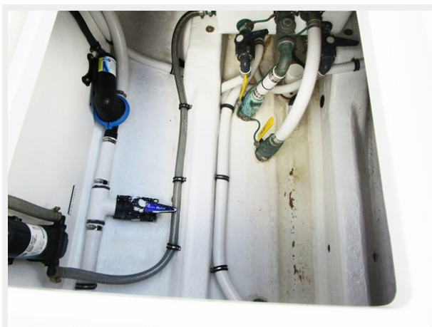
Pumps Under Deck