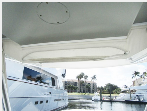
Vent Over Front Enclosure