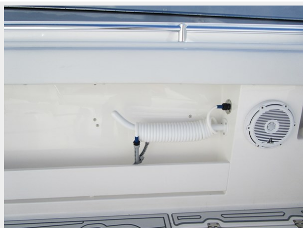
One of 4 Washdown Hoses