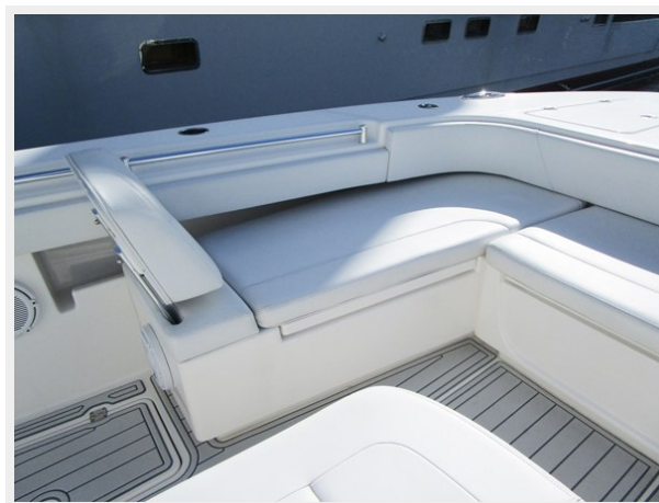
Port Side Bow Seat