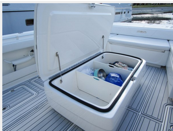
Coffin Box Storage