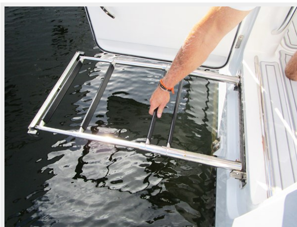
Dive Door Ladder