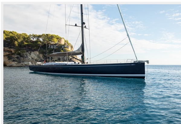
Sailing Yacht SHAMANNA 4