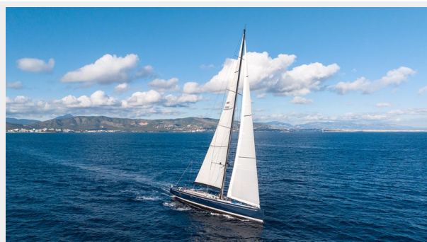
Sailing Yacht SHAMANNA 1