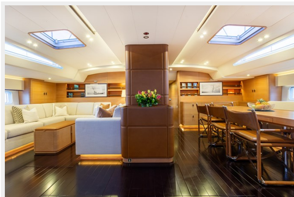
Sailing Yacht SHAMANNA - Main salon 1