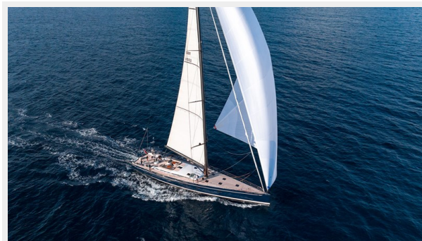
Sailing Yacht SHAMANNA 2