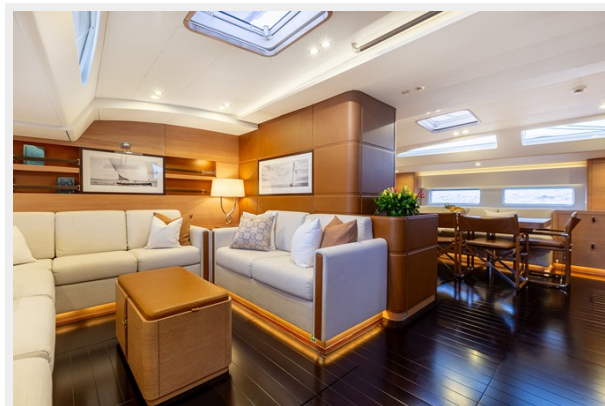
Sailing Yacht SHAMANNA - Main salon 2