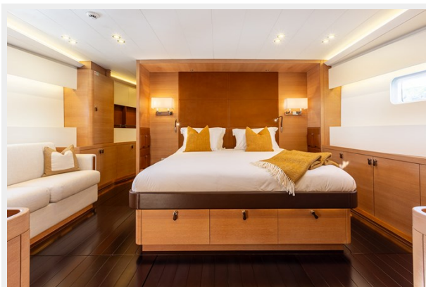
Sailing Yacht SHAMANNA - Master Cabin 1