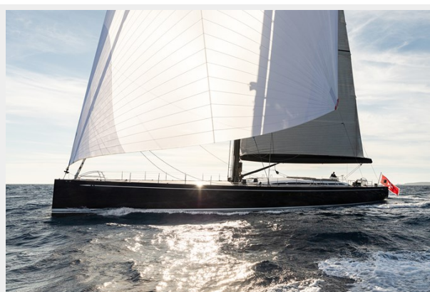
Sailing Yacht SHAMANNA 3