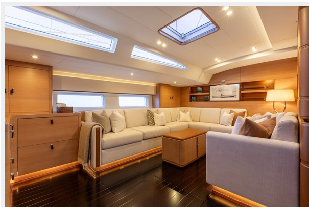
Sailing Yacht SHAMANNA - Main salon 3