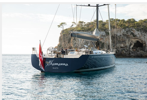
Sailing Yacht SHAMANNA 5