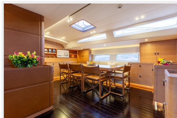
Sailing Yacht SHAMANNA - Main salon 4