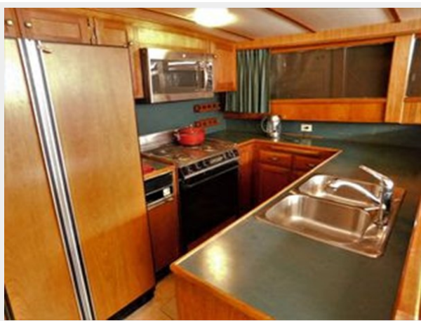
Monk-McQueen 74 Motoryacht - Galley