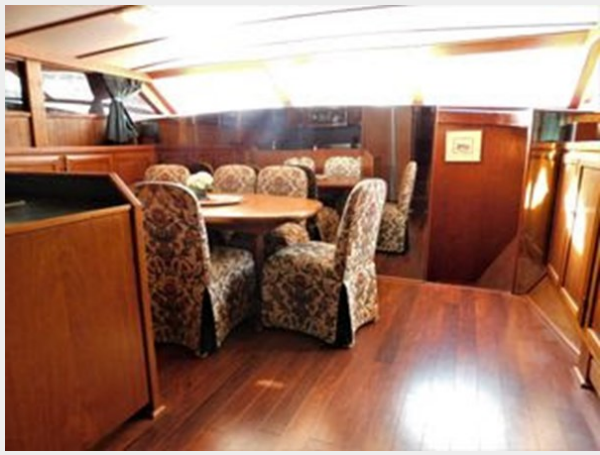
Monk-McQueen 74 Motoryacht - Looking Forward Interior