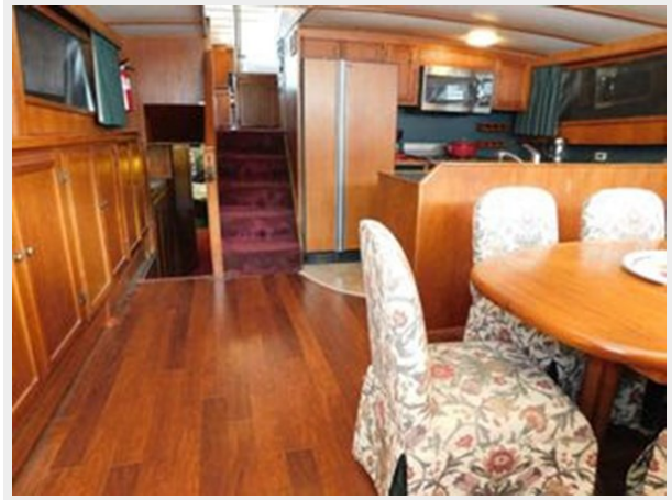
Monk-McQueen 74 Motoryacht - Looking Aft Interior