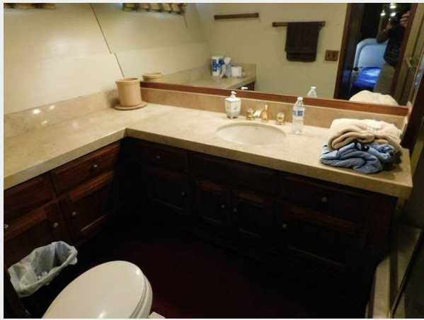
Monk-McQueen 74 Motoryacht - Head