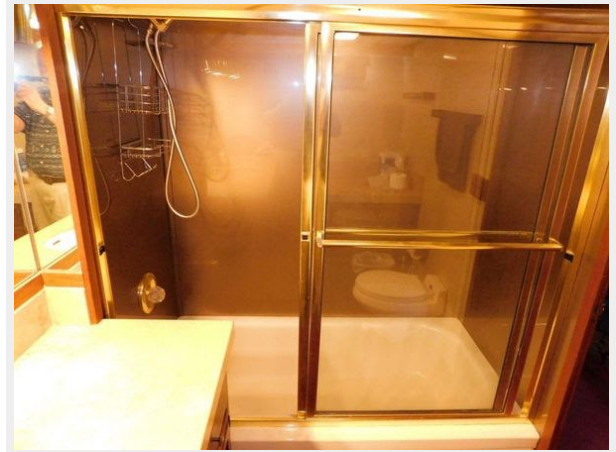
Monk-McQueen 74 Motoryacht - Shower