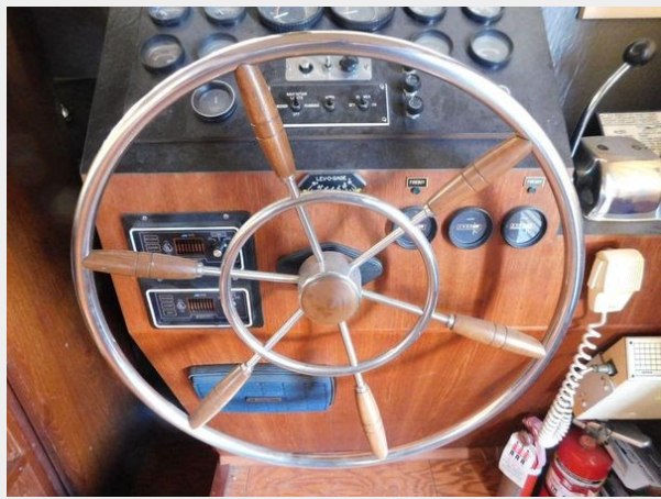
Bluewater 51 Coastal Cruiser - Helm