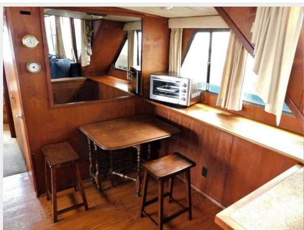
Bluewater 51 Coastal Cruiser - Salon Table