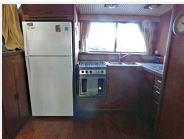
Bluewater 51 Coastal Cruiser - Galley