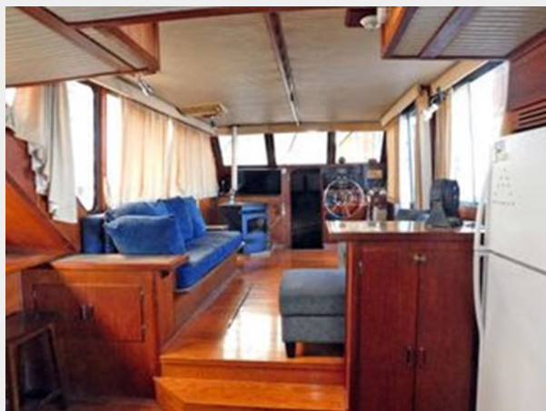
Bluewater 51 Coastal Cruiser - Looking Forward