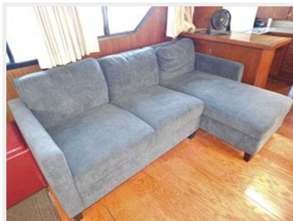
Bluewater 51 Coastal Cruiser - Salon