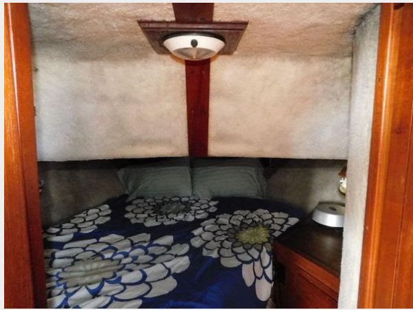
Bluewater 51 Coastal Cruiser - Guest Cabin