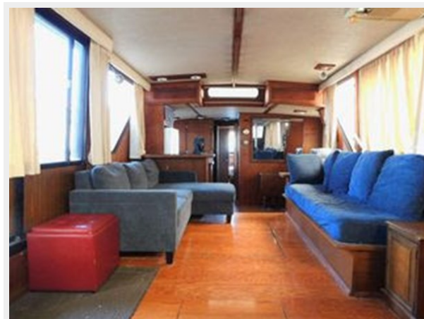
Bluewater 51 Coastal Cruiser - Looking Aft