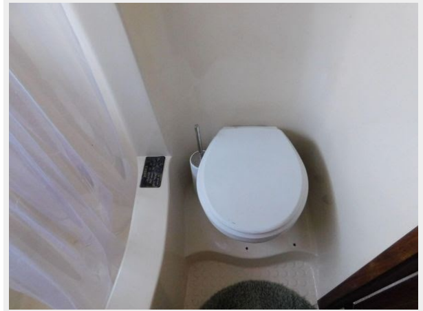
Bluewater 51 Coastal Cruiser - Head