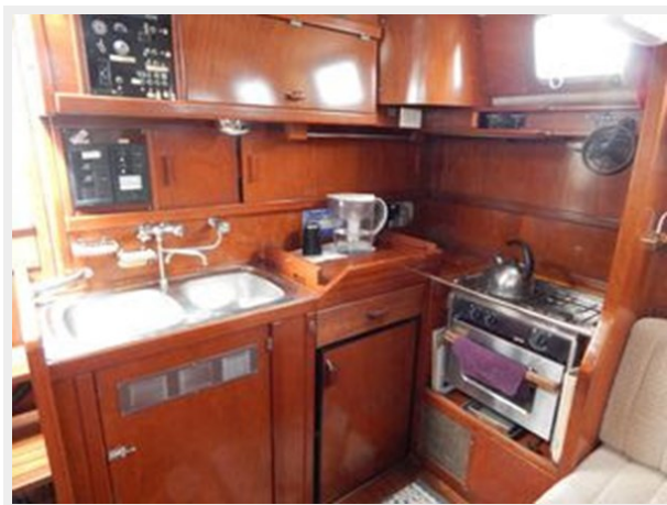
Amel Maramu 46 Ketch - Galley