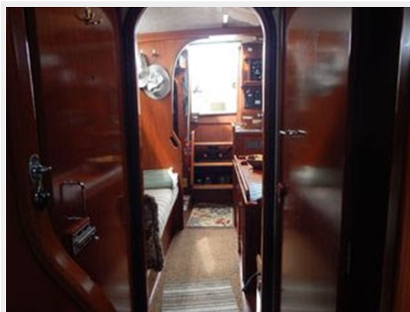
Amel Maramu 46 Ketch - Looking Aft