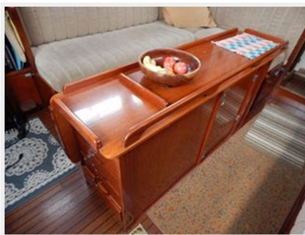
Amel Maramu 46 Ketch - Saloon