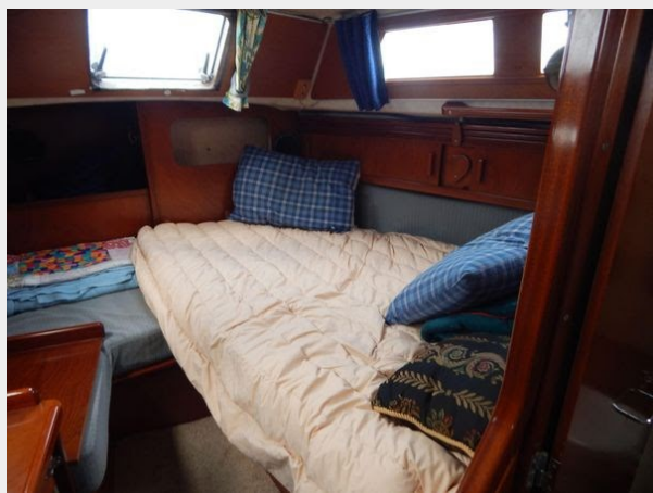
Amel Maramu 46 Ketch - Master Suite