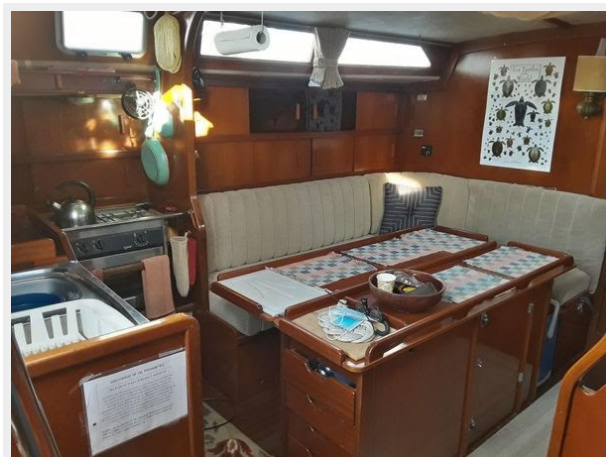
Amel Maramu 46 Ketch - Saloon Table