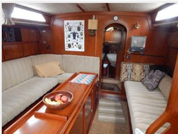
Amel Maramu 46 Ketch - Looking Forward