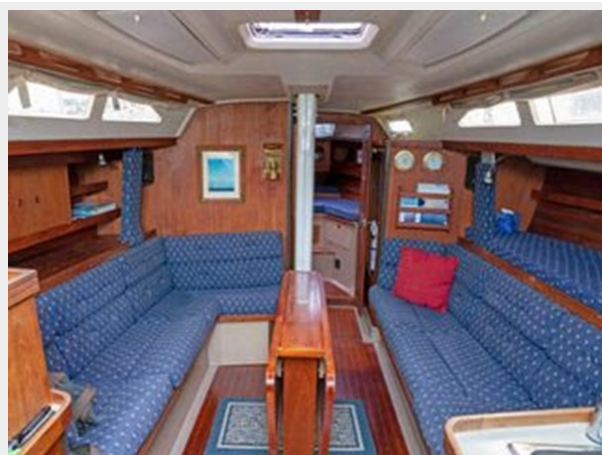
C&C 38 - Looking Forward