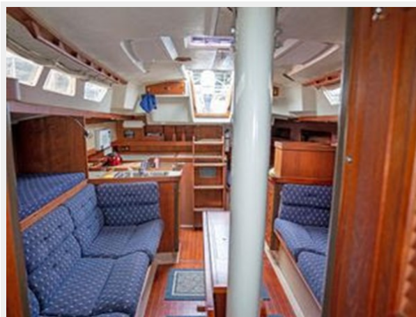
C&C 38 - Looking Aft