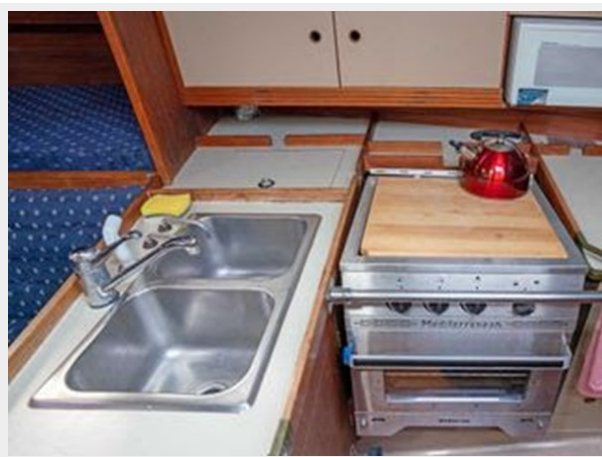
C&C 38 - Galley