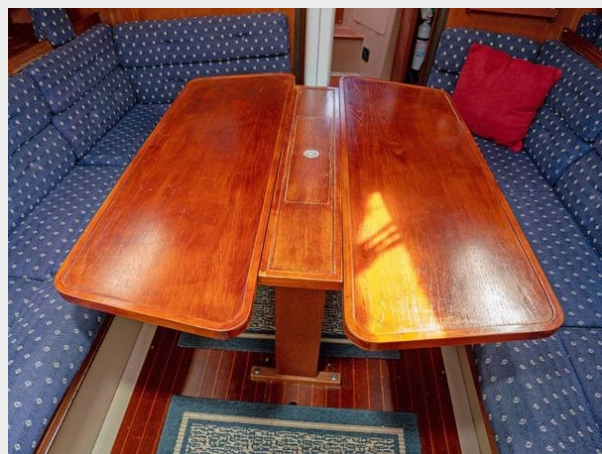
C&C 38 - Saloon Table