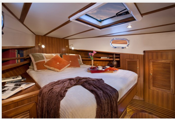
Helmsman Trawlers 38 Sedan Owner's Cabin