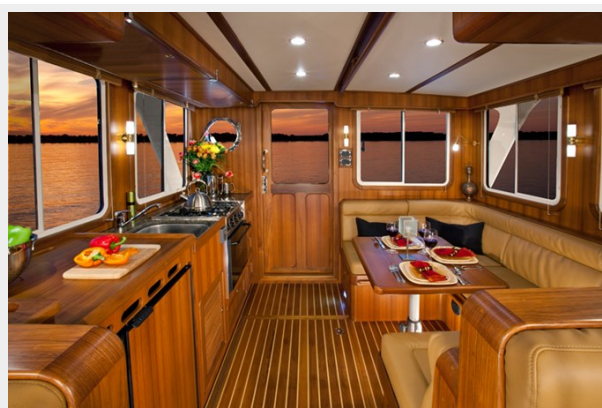
Helmsman Trawlers 38 Sedan Looking Aft