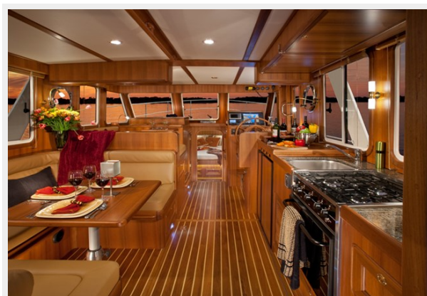
Helmsman Trawlers 38 Sedan Looking Forward