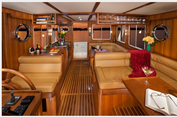
Helmsman Trawlers 38 Sedan Looking Aft