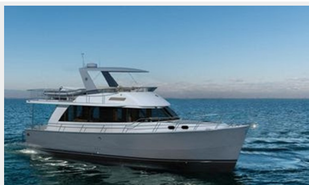
Helmsman Trawlers 43 Sedan Rendition 2