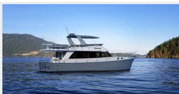
Helmsman Trawlers 43 Sedan Rendition 6