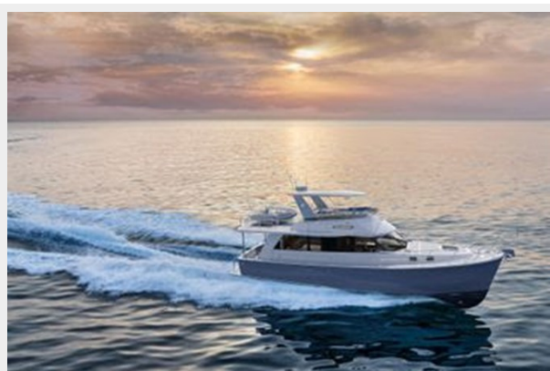
Helmsman Trawlers 43 Sedan Rendition 4