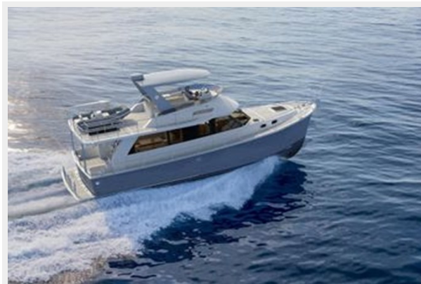
Helmsman Trawlers 43 Sedan Rendition 3