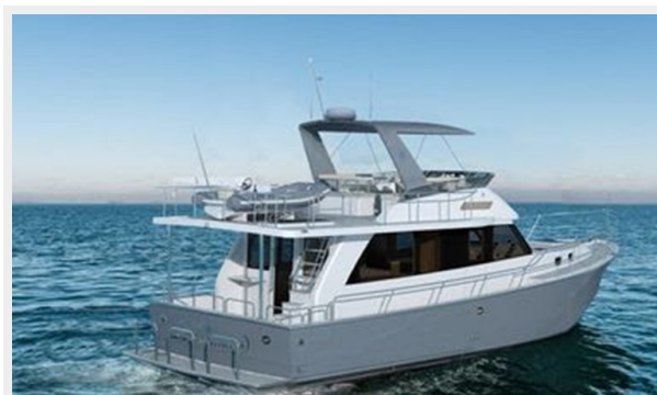
Helmsman Trawlers 43 Sedan Rendition 5