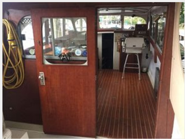
Richardson Deluxe Sedan Cruiser 34 - Looking Forward