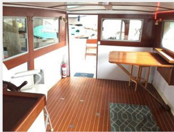
Richardson Deluxe Sedan Cruiser 34 - Looking Aft