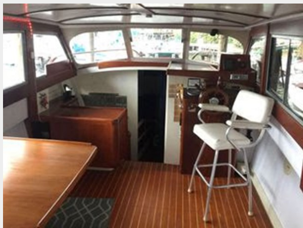
Richardson Deluxe Sedan Cruiser 34 - Salon