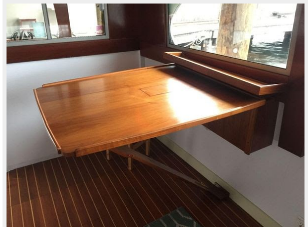
Richardson Deluxe Sedan Cruiser 34 - Salon Table