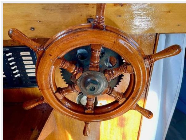
Stockland 36 Trawler Conversion - Helm