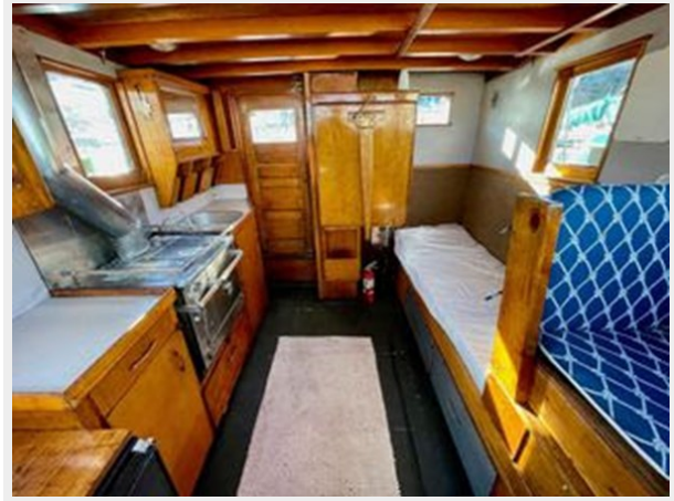
Stockland 36 Trawler Conversion - Looking Aft