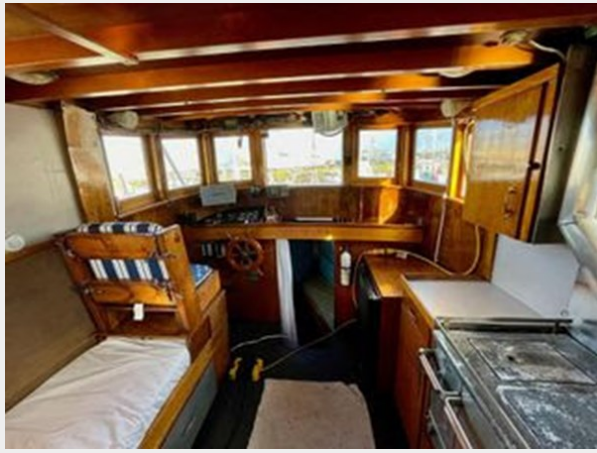
Stockland 36 Trawler Conversion - Looking Forward