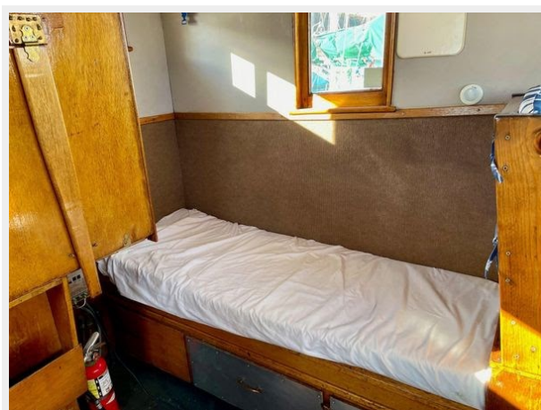
Stockland 36 Trawler Conversion - Salon