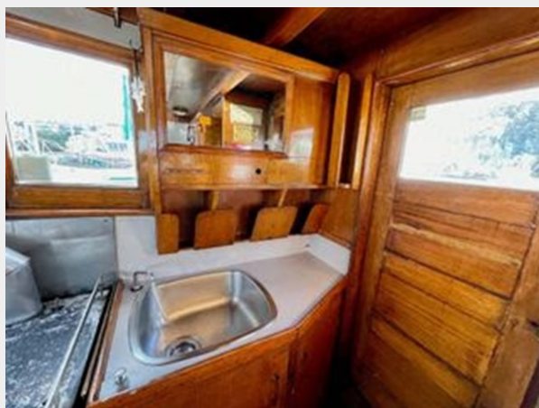
Stockland 36 Trawler Conversion - Galley