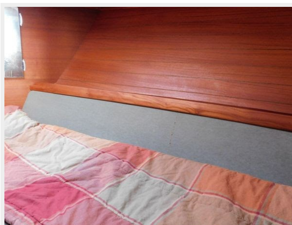
Trojan F-32 Flybridge Sportfish Sedan - Forward Cabin