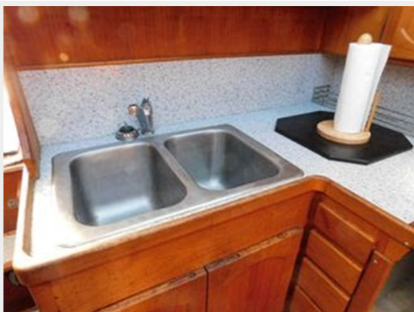
Trojan F-32 Flybridge Sportfish Sedan - Galley