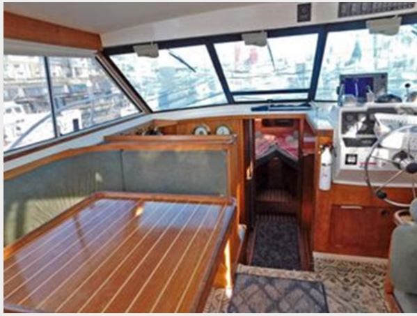
Trojan F-32 Flybridge Sportfish Sedan - Looking Forward