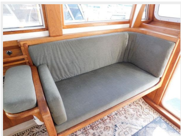
Trojan F-32 Flybridge Sportfish Sedan - Salon