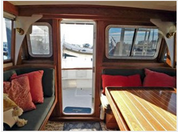
Trojan F-32 Flybridge Sportfish Sedan - Looking Aft