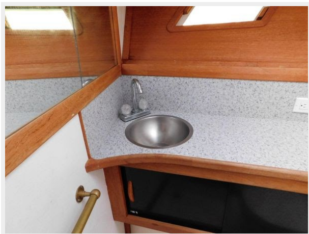
Trojan F-32 Flybridge Sportfish Sedan - Head