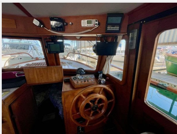
Universal 36 Trawler Tri-Cabin - Helm