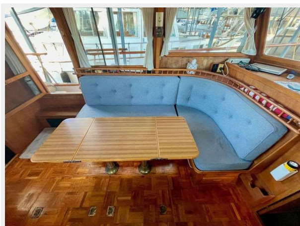
Universal 36 Trawler Tri-Cabin - Salon Table