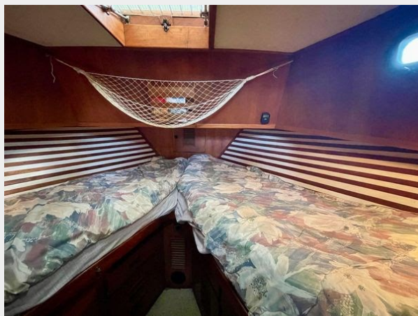
Universal 36 Trawler Tri-Cabin - Forward Cabin