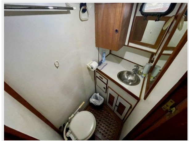
Universal 36 Trawler Tri-Cabin - Head