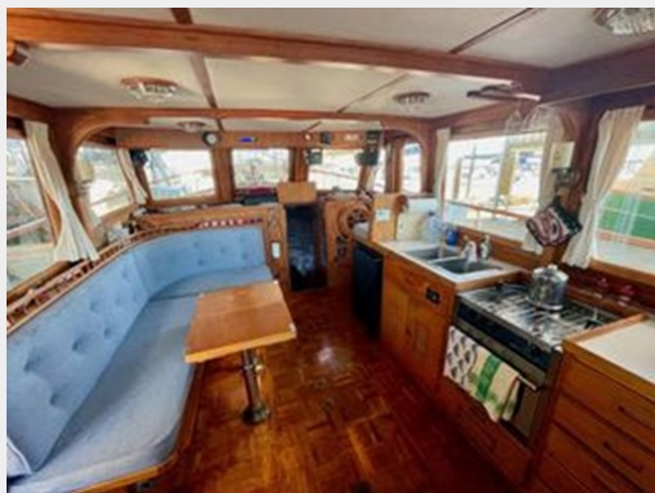
Universal 36 Trawler Tri-Cabin - Looking Forward