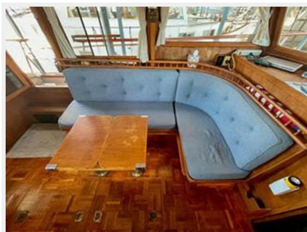
Universal 36 Trawler Tri-Cabin - Salon