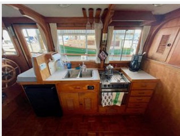
Universal 36 Trawler Tri-Cabin - Galley