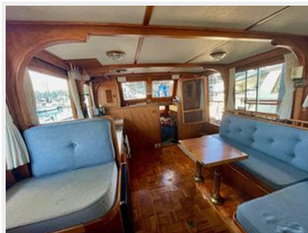
Universal 36 Trawler Tri-Cabin - Looking Aft