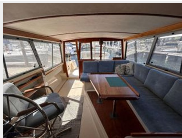
Bayliner 3270 Explorer - Looking Aft