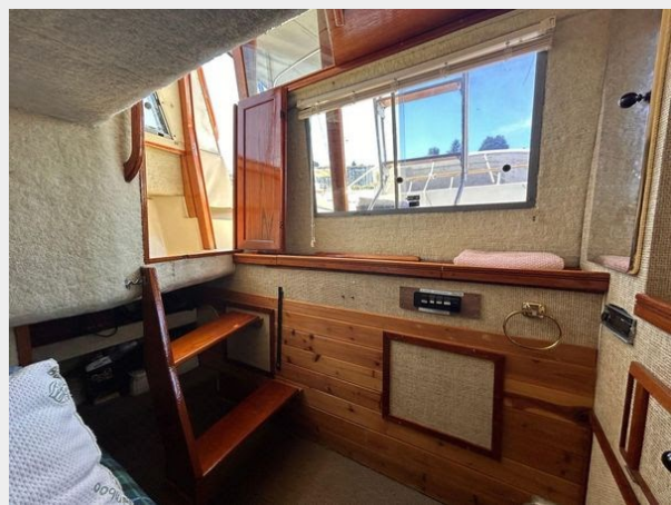
Bayliner 3270 Explorer - Aft Cabin