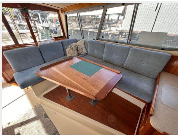
Bayliner 3270 Explorer - Salon