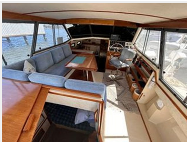
Bayliner 3270 Explorer - Looking Forward