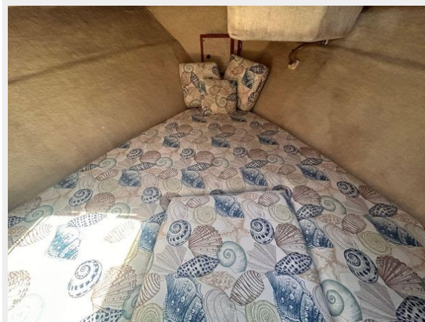
Bayliner 3270 Explorer - Forward Cabin