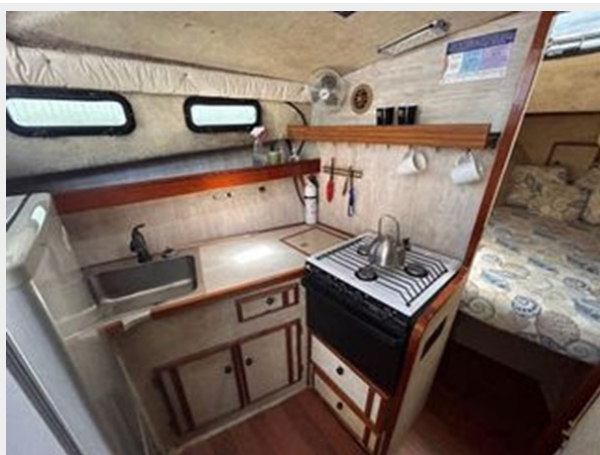
Bayliner 3270 Explorer - Galley