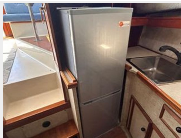
Bayliner 3270 Explorer - Galley Fridge