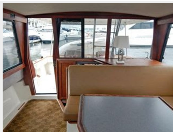
Bayliner 3288 - Looking Aft