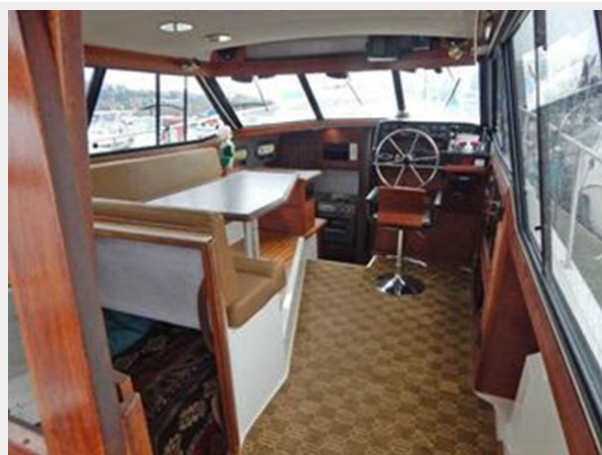
Bayliner 3288 - Looking Forward