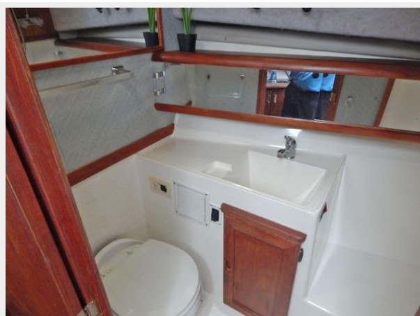
Bayliner 3288 - Head