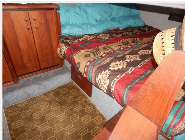
Bayliner 3288 - Aft Cabin