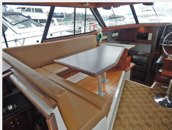
Bayliner 3288 - Salon