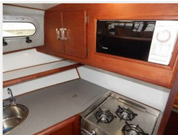
Bayliner 3288 - Galley