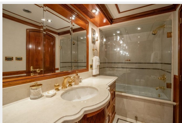
Lower Deck Ensuite