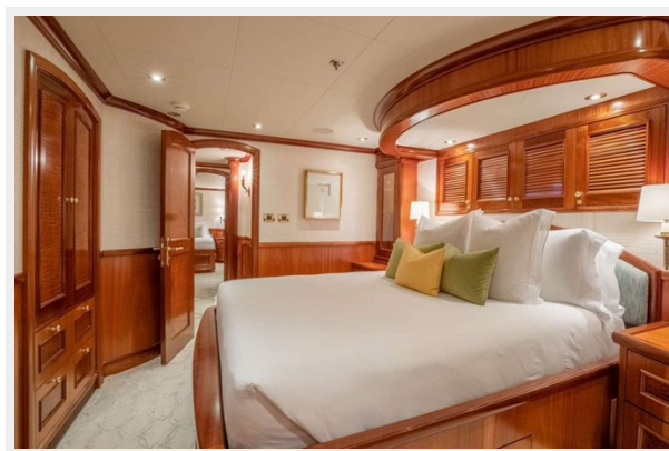
Lower Deck Guest Stateroom