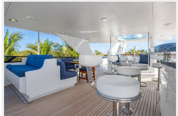
Sun Deck Seating Area