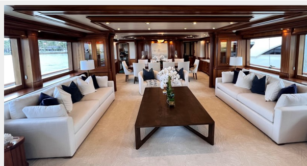
MISS STEPHANIE 138' (42m) Richmond Motoryacht, 2004/2023 - Main Deck Salon