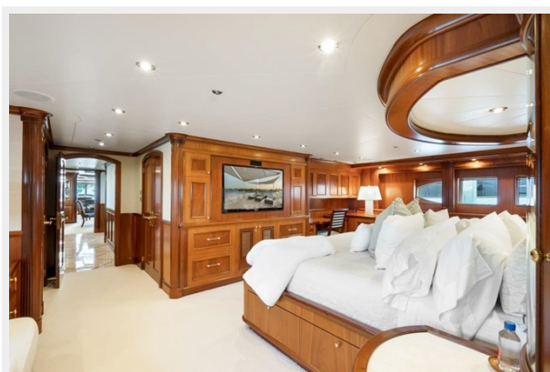
Main Deck Master Stateroom