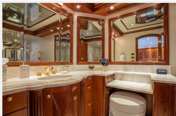
Main Deck - Master Ensuite