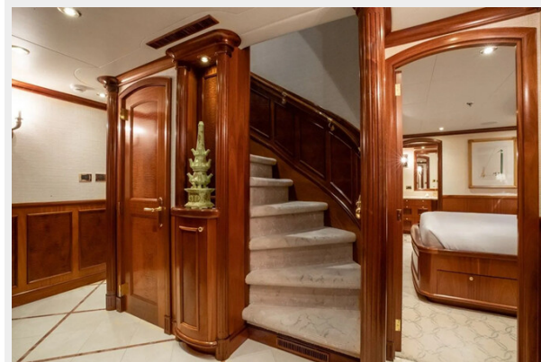
Stairs to Lower Deck