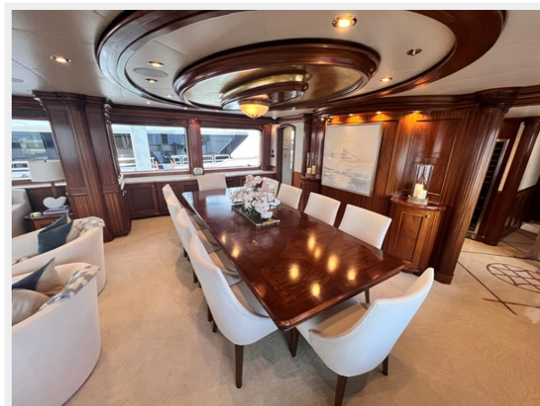
Main Deck Dining