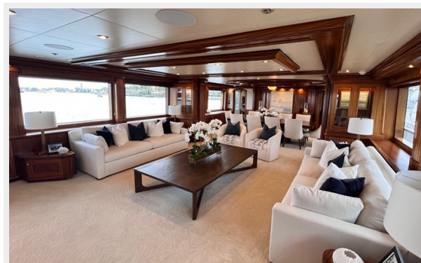
Main Deck Salon