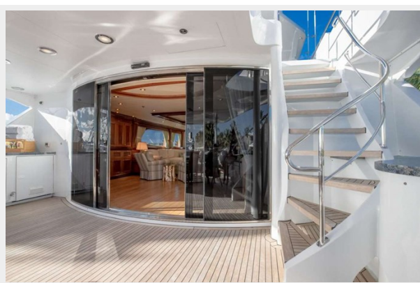
Bridge - Aft Deck