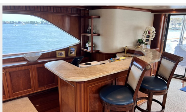
Main Deck Bar