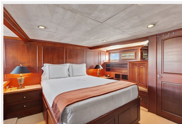
5. Master Cabin