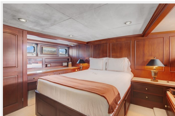
6. Master Cabin