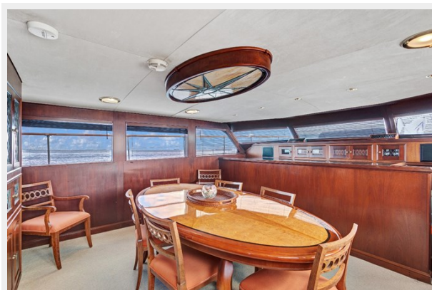
4. Dining Salon